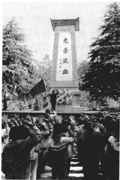
“光荣流血”徐家烈士墓纪念碑。

清朝末年，外国列强不断入侵中国，清政府为保住摇摇欲坠的封建政权，被迫签订了一个又一个丧权辱国的不平等条约。大量的民脂民膏被无能的政府搜刮去，用于偿付巨额战争赔款。政府无能，老百姓的生活更是暗无天日，悲惨至极。为了