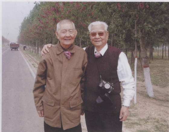
2005年，与原黄河水利委员会主任袁隆察看黄河标准化堤防时留影