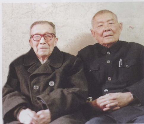
1993年，与原水利 部工管司司长、著名水 利专家刘德润合影