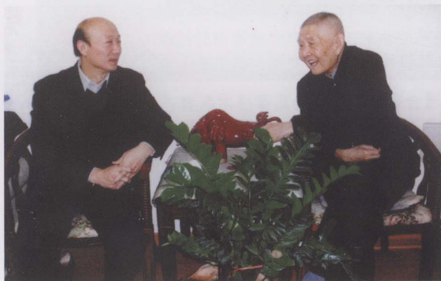
2009年，与黄河水利委员会副主任廖义伟讨论黄河防凌事宜