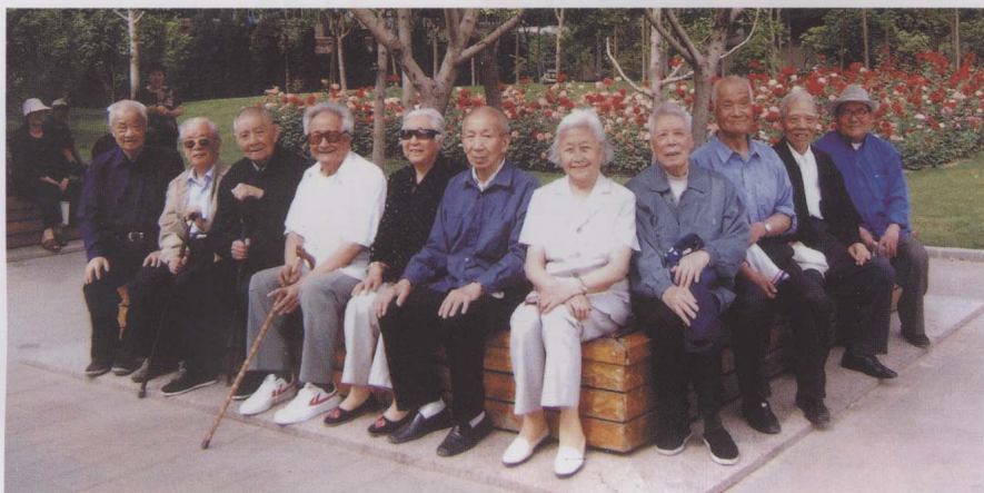
2008年，一群80岁以上的老人合影（左三为作者）