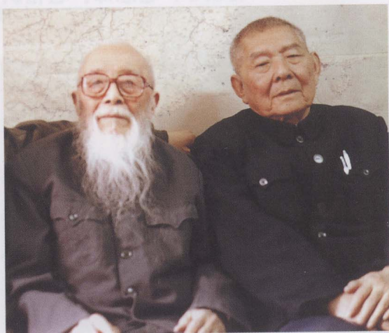
1993年，与原水利部 副部长、著名水利专家张含 英合影