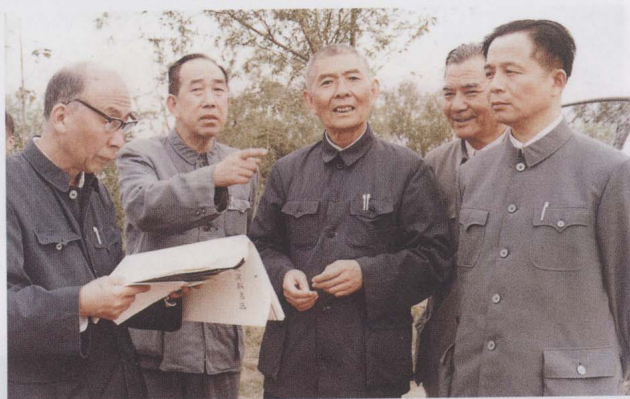
1983年5月， 与河南省委书记刘杰 （左一）、河南省省 长何竹康（右一）、 水利电力部副部长李 伯宁（左二）、黄河 水利委员会主任袁隆 （右二）参加黄河防 汛查勘