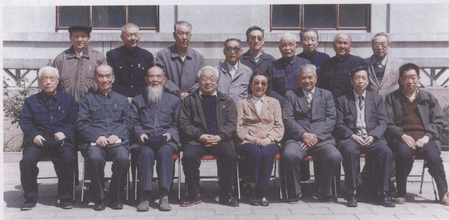
20世纪80年代，水利电力部部长钱正英等视察黄河时合影。前排左起：全允皋、汪雨亭、吴以敦、龚时扬、钱正英、袁隆、徐乾清（时任水利电力部总工程师）、刘金，后排左起：郝步荣、作者、李玉峰、王锐夫、龙毓骞、沈衍基、陈赞庭、李延安、王长路