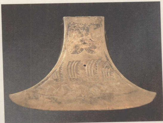
◎石秃山出土的铜钺上有越民划船的图案