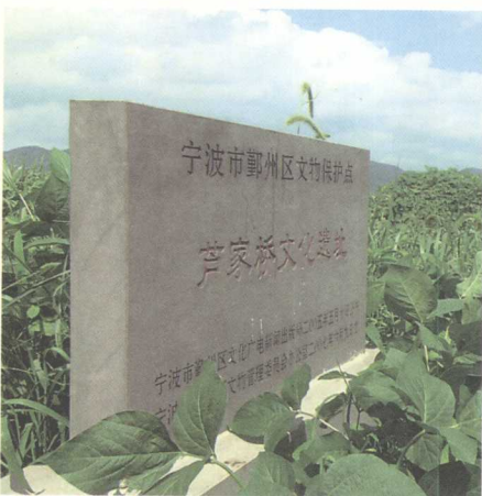
◎芦家桥文化遗址坐落在山与平原交界处

在鄞县古林镇芦家桥村发现了河姆渡第三层的文化，距今约五千年。这里最有特色的是先人编织的芦席，用作房屋的墙壁以挡风避雨。