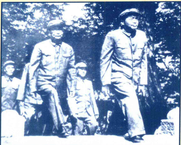
1953年7月在朝鲜。李克农(前左)与彭德怀(前右)在朝鲜停战协定及临时补充协议上正式签字前步入会场。