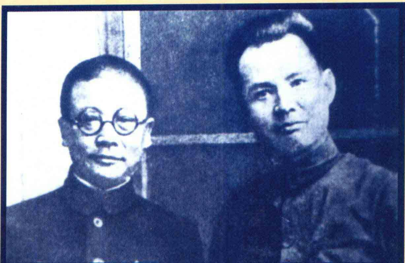
1937年中共代表叶剑英(右)和李克农在西安。