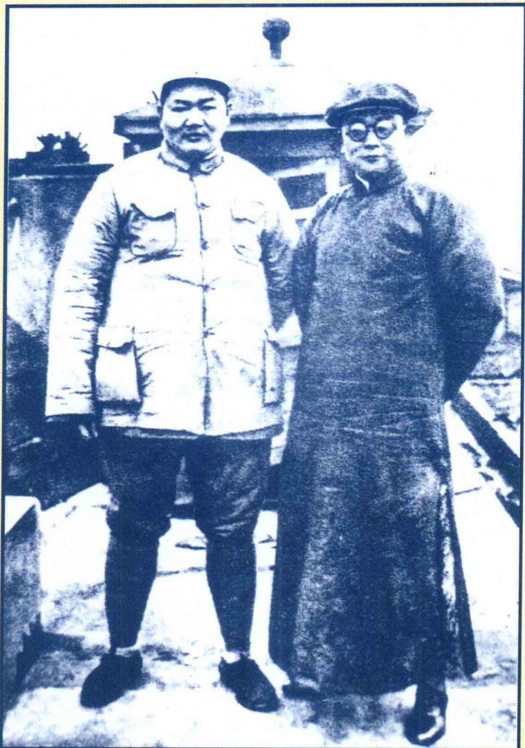
1938年，中共长江局秘书长李克农(右)和第十八集团军高级参谋罗炳辉在办事处。