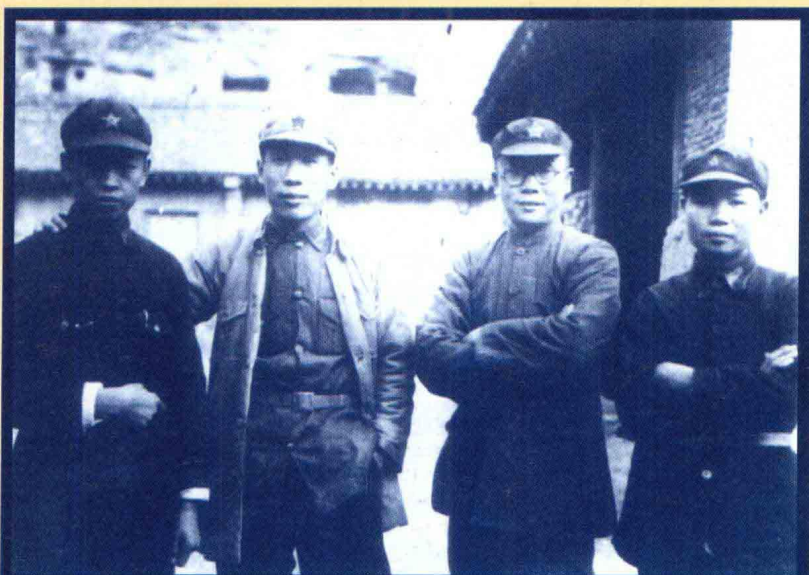
西安事变前，钱江(左一)、伍修权(左二)、李克农(左三)、井茂然(左四)于保安合影。