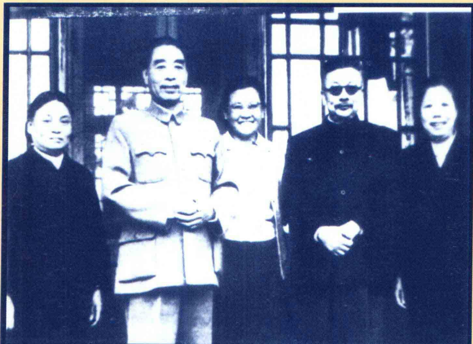
1960年，周恩来、邓颖超探望病中的李克农，并与李克农及夫人赵瑛(左)、女儿李冰合影。