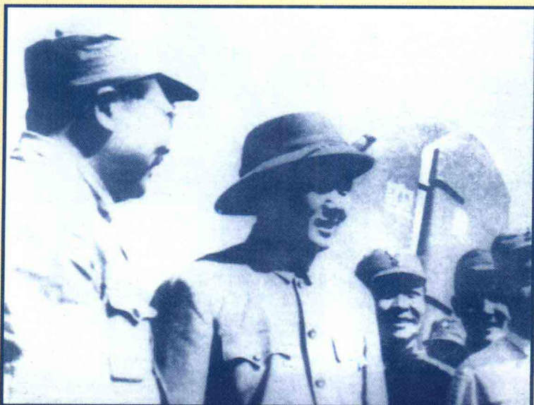
1945年8月毛泽东(左二)赴重庆谈判，李克农(左一)等人在延安机场送行。