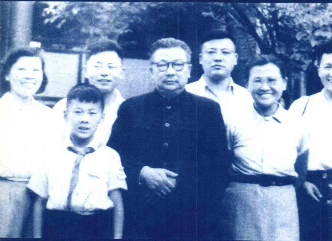
1957年，李克农全家在北京合影。自左至右：李宁、李治之子李幕兰，李伦、李克农、李治、李波、李力。