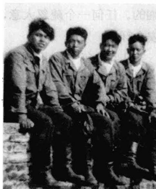
三个学生与教员（左一）