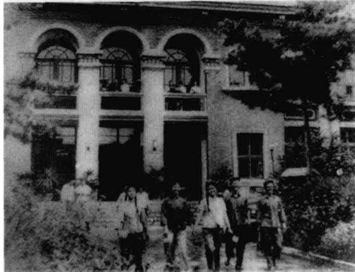
震前的市政府交际处、唐山市图书馆