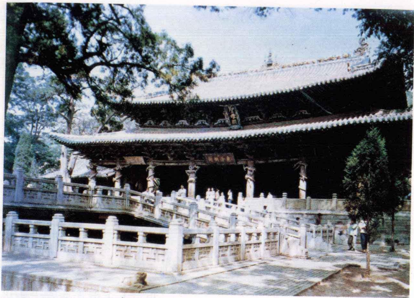
山西太原晋祠圣母殿