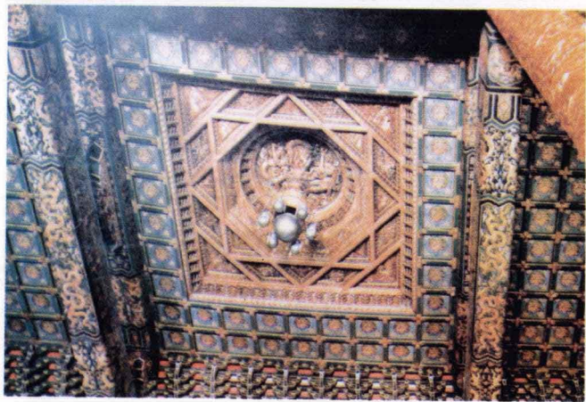
北京故宫太和殿藻井(细部)