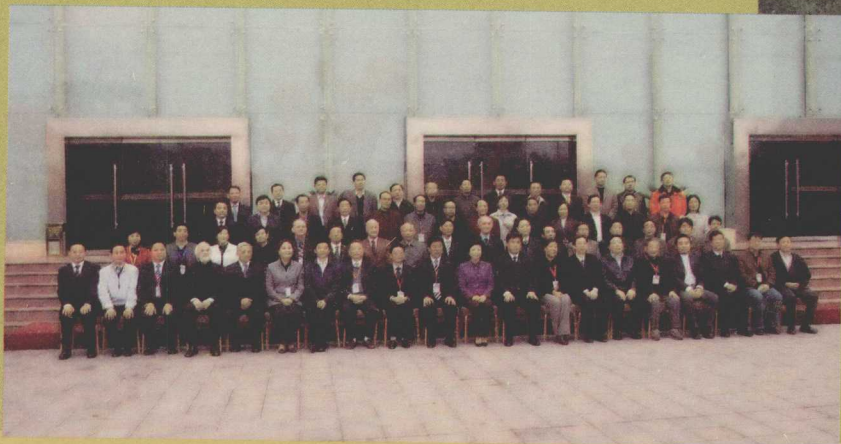
出席“2009中国蜀道·广元国际论坛”的领导和专家、代表合影