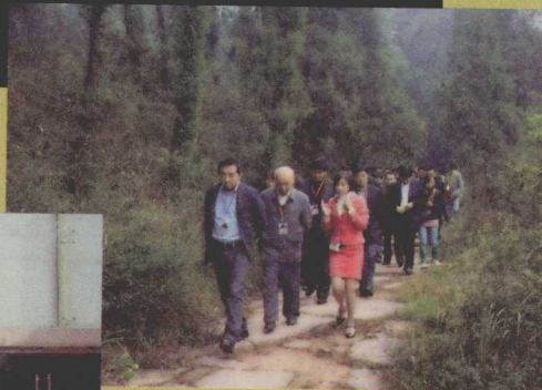
与会专家体验剑门蜀道