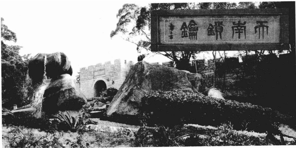
厦门胡里山炮台《天南锁钥》西大门，史为“岩疆锁钥”

福建古为闽地，在元代分为福州、兴化、建宁、延平、汀州、邵武、泉州、漳州八路，明代改为八府，清代沿用，福建因此称为八闽。