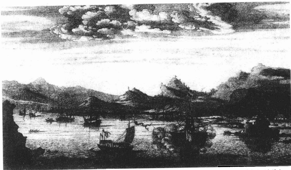
明末(1633年7月12日)荷兰战船突袭厦门港图(荷人画像)。