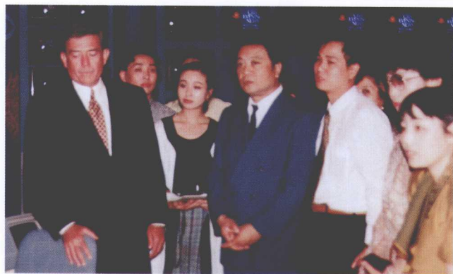
>>> 1993年中国主持人代表团在美国CBS总部与著名主持人丹·拉瑟（左一）在一起