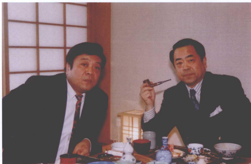
>>> 与国画大师范曾交往多年受益匪浅