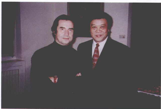
>>> 与维也纳新年音乐会指挥穆蒂合影