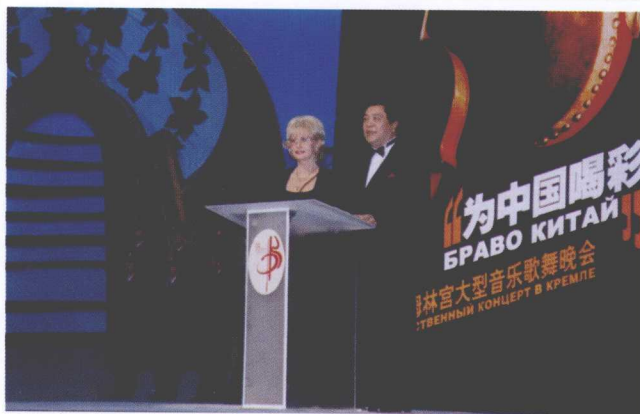
>>> 在莫斯科克林姆林宫大剧院