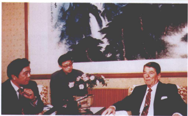
>> 1982年在钓鱼台采访时任美国总统里根