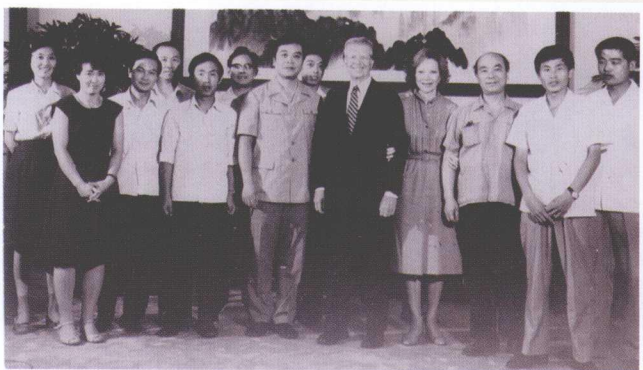
>> 1983年在钓鱼台采访美国前总统卡特