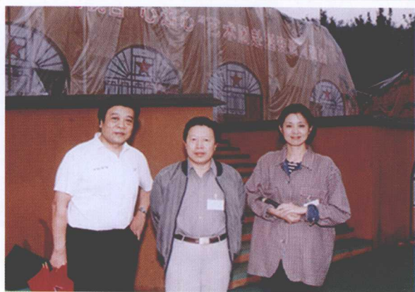
>>> 与孙家正、倪萍在延安