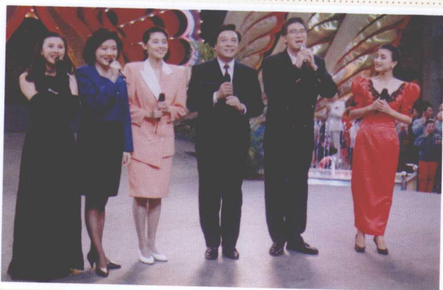
>>> 主持春节联欢晚会