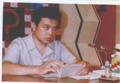
>>> 1981年主持第一届中学生智力竞赛