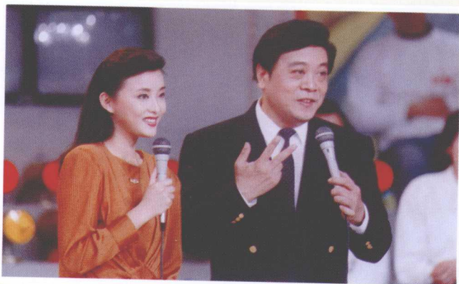
>>> 与杨澜主持《正大综艺》