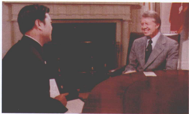
>> 1979年在白宫采访时任美国总统卡特