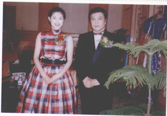
>>> 与倪萍主持香港回归晚会