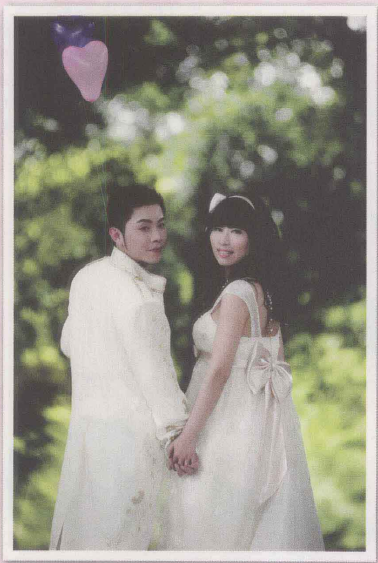
● NIKON D200 / 快门速度 1/100秒 / 光圈 F3.3 / 焦距 200 / ISO 100 / 曝光补偿 0 / 测光方式 中央测光 / 拍摄程序 手动模式 / 大光圈加上长焦端，背景可以被虚化成光斑。

远离背景： 要让浅景深的效果明显，被摄者要尽量远离背景。如果你没有大光圈镜头，运用主体远离背景的手法，也可以拍出浅景深的感觉。 突出主体： 使用望远镜头时，构图可以紧密一些，在大特写时，甚至大胆的裁切，开大光圈。高素质的望远镜头，在大光圈时的画质也不错，可以适度的开大光圈来拍摄，当然，也要注意焦点。