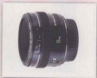
佳能 EF 50mm f/1.4

对于新闻报导摄影者来说，标准镜头是说故事的镜头，这个说法对人像摄影者来说，也是如此。与其想尽办法要简化背景，不如让适当的背景，为我们的人像摄影增加一些故事的感觉。对于绝大多数的摄影者来说，焦距在18-55mm左右的标准变焦镜头应该是最实用、最常用的镜头。如果能升级到f2.8的等级，在55mm焦距时也可以享受f2.8带来的浅景深。基本上，这一类的镜头全开光圈的画质还是蛮不错的。