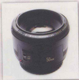
佳能EF 50mm f1.8

我们前面提到传统135片幅的85-135mm的焦距适合当成人像镜，经换算回APS-C的焦距，就是将135片幅适用的焦距除以1.5或1.6之后，大约是56-90mm左右。如果以实际在市场上销售的镜头焦距来看，用于APS-C片幅实际在50-90mm左右的焦距便成了值得推荐的人像镜选择。以近年热门的拍摄手法看来，最受欢迎的人像镜头显然是50mm这个焦距。原因有几个，一来它的焦距适中，让拍摄者和模特儿可以保持在一个轻松愉快的距离，既不会太远，也不会太近。而在价格方面，用在APS-C上的50mm f1.8，比起类似用途的供135片幅拍摄使用的85mm f1.8来说，价格只有1/4，却仍有不错的效果，真有大赚一笔的感觉。为此，大家当然狂推50mm的镜头。