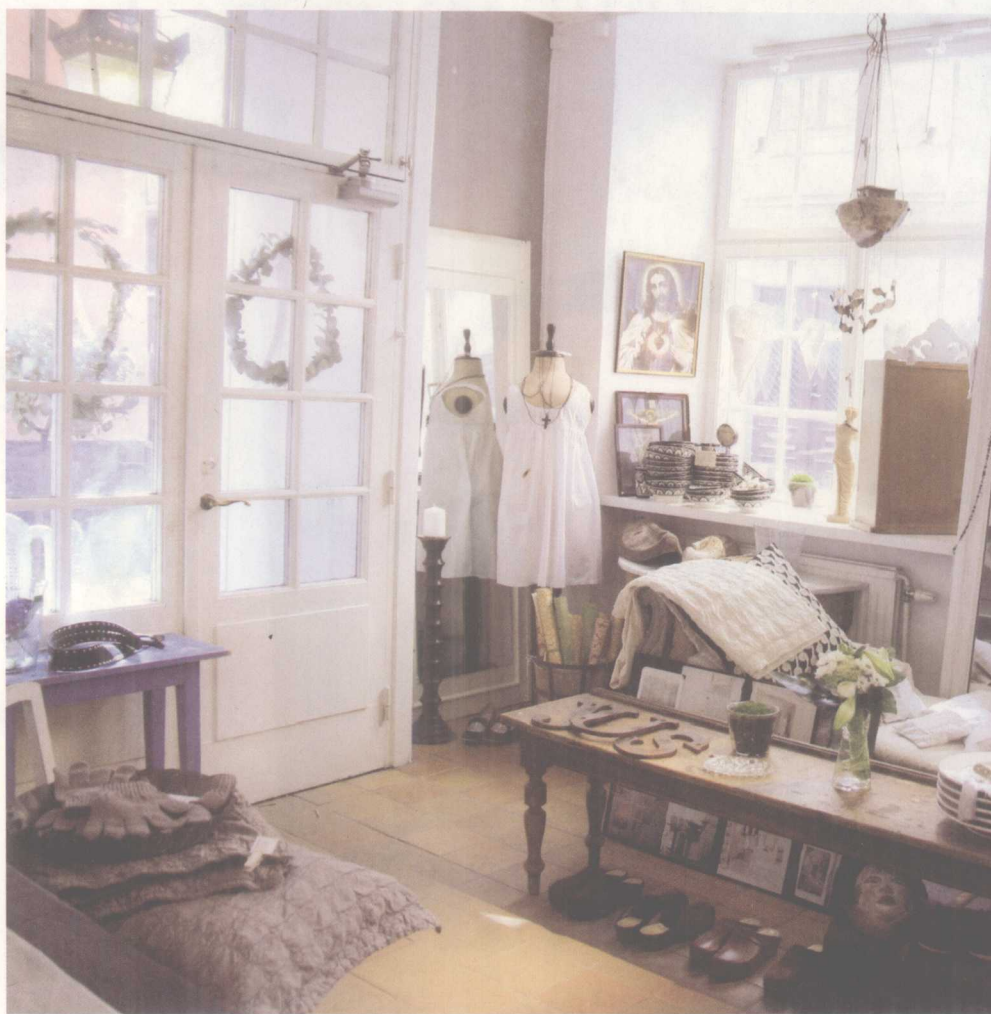
运用落地镜为狭小空间制造视觉放大效果。