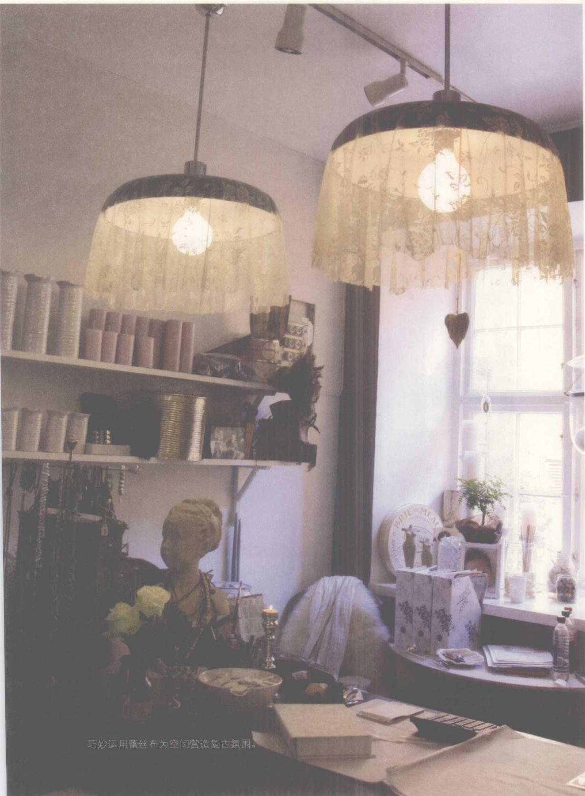
巧妙运用蕾丝布为空间营造复古氛围。