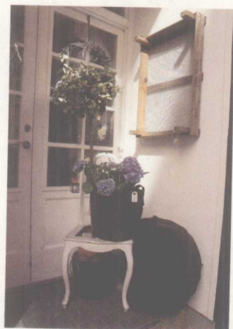
借由绿意创造窗台一片蓬勃的生气。