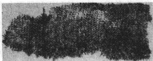
图3 浙江吴兴钱山漾出土的残绸片

1958年，在距今4700年左右的浙江省钱山漾新石器时代遗址中，出土过一些纺织品。经鉴定，这些纺织品中有丝、麻两类。丝织品有绸片、丝线和丝带，绸片尚未完全碳化，呈黄褐色，长2.4厘米，宽1厘米，