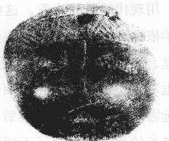
图1 浙江余姚河姆渡出土盂形骨器上的蚕纹

此外，在河北正定南杨庄和山西的仰韶文化遗址中曾出土过陶蚕；甘肃省临洮县冯家坪遗址和安徽省蚌埠市郊吴郢遗址出土的陶罐壁上，亦曾发现蚕形图案。