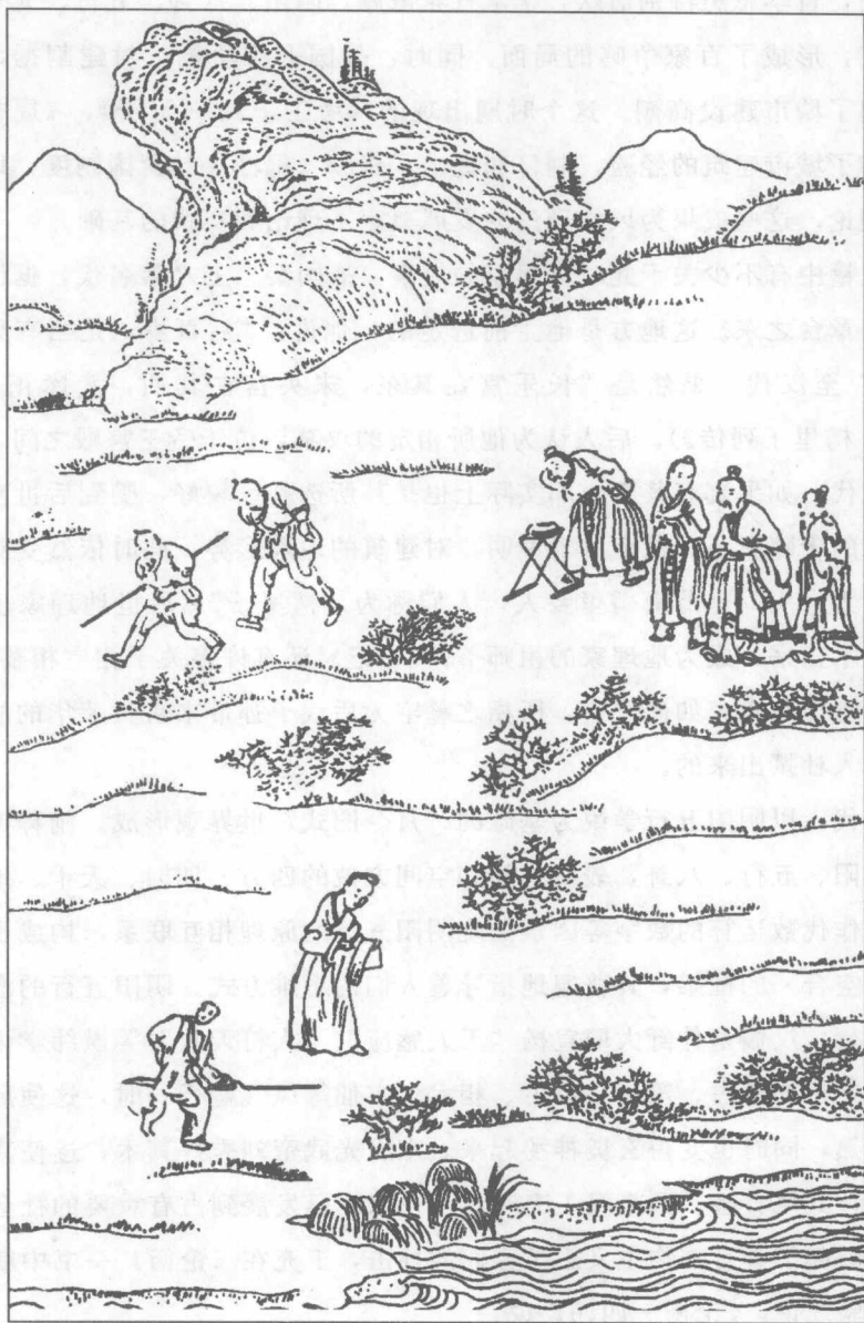
图 1—3 太保相宅图