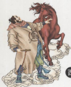
午将胜光 光怪、丝绵、文书之神