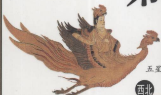
太白星神 五星之一，五行属金