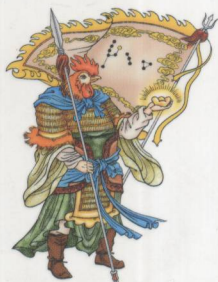
酉将从魁 赏赐、解散、金刀之神