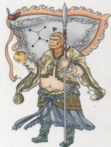
申将传送 道路、疾病之神