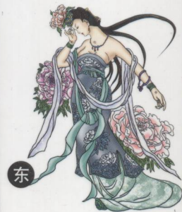
子将神后 阴私、暗昧、妇女之神