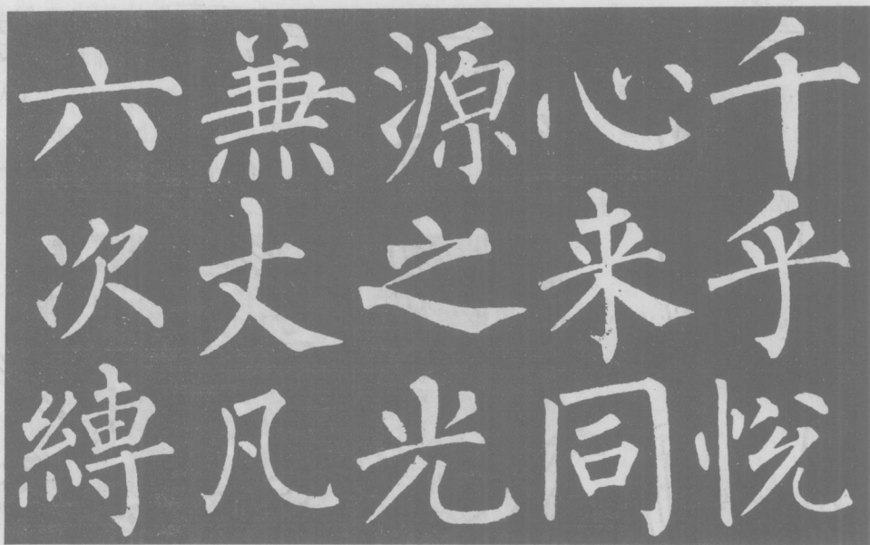
图 1-1-4 柳公权书《玄秘塔碑》点画组织及运动方向 后旁。对外有方框，框内有笔画的字，笔顺则是先内后封口。例如：