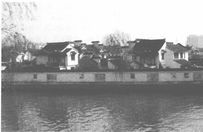
图 1-1 苏杭民居

建筑具有强烈的社会性，即使是满足了各种使用功能和人类的共性需要，对于不同的民族和不同的地区，人们对建筑空间的要求仍有很大的差异，不同的民族有着不同的信仰心理要求，它不仅满足着各个民族各自活动的需要，而且还在长期的历史发展中，逐渐成为民族的象征。古典柱式象征着欧洲文化，带有琉璃瓦的大屋顶的建筑则象征着中华文化。这种象征意义对于建筑室内空间的设计构思影响颇深。即使在同一个民族中，不同的地域对建筑室内空间形式也有不同的要求。例如同样是汉族民居的苏杭民居（图 1-1）、福建民居（图 1-2）和北京的民居都各具特色，这固然有气候、地貌、生态等自然因素的影响，但更多的是人们的生活方式、民情风俗、社会经济水平等人文因素的影响。