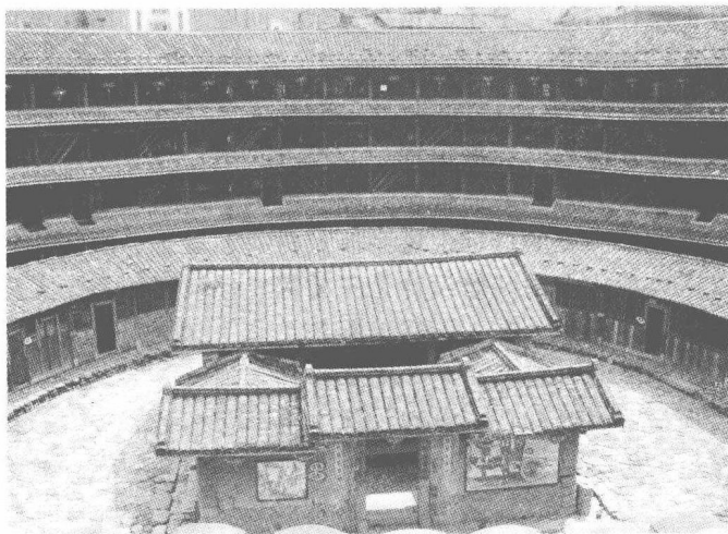
图 1-2 福建土楼民居