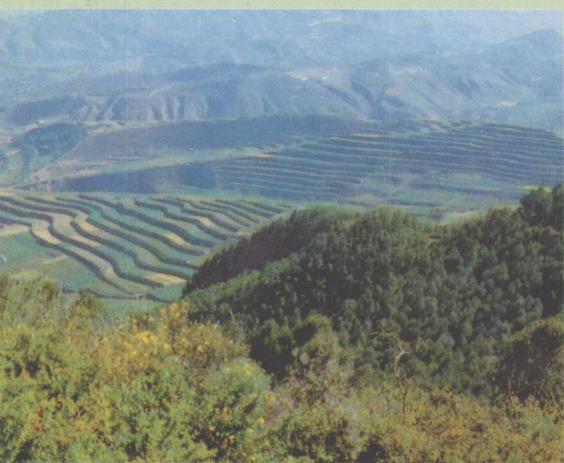
△朔北马场山间梯田