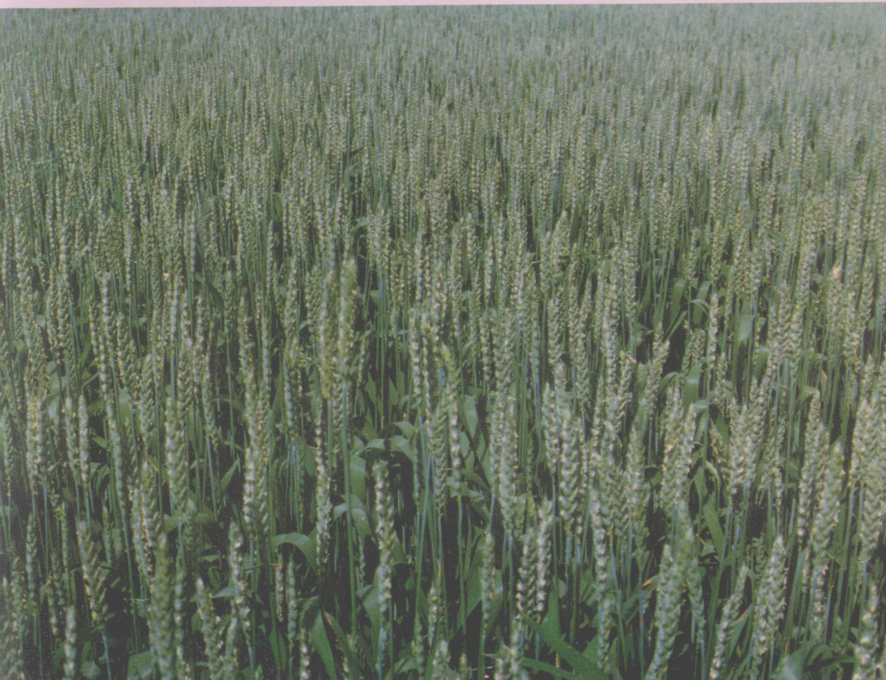
▽青春 533 小麦大面积丰产田