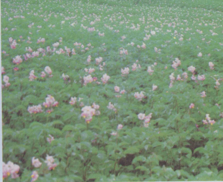
△青薯 168 丰产田