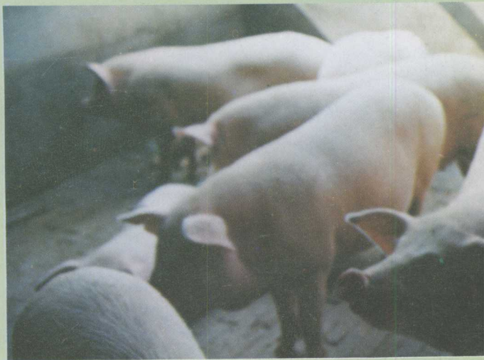
△万头猪场饲养的瘦肉型猪