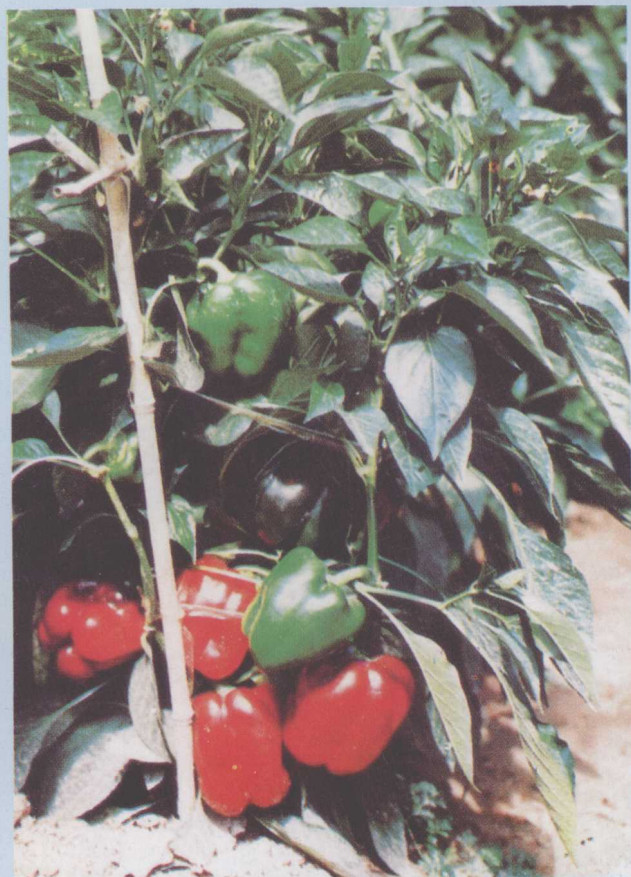
△大棚丰产栽培“茄门二号”甜椒单株