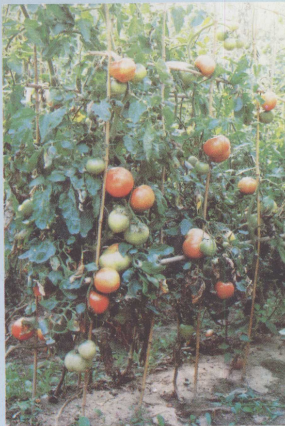
△大棚丰产栽培“青海大红”番茄