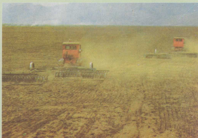
△东方红—75型拖拉机牵引41片轻型圆盘耙进行耙地作业