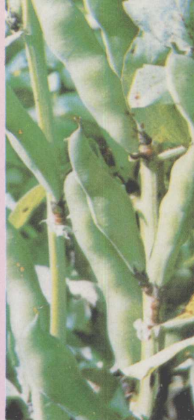
△青海 3 号蚕豆