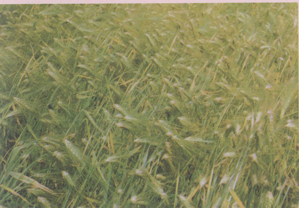
▽北青 1 号青稞良种田