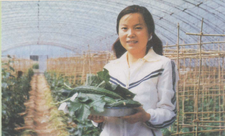
▷大棚丰产栽培“长春 密刺”黄瓜早期采收