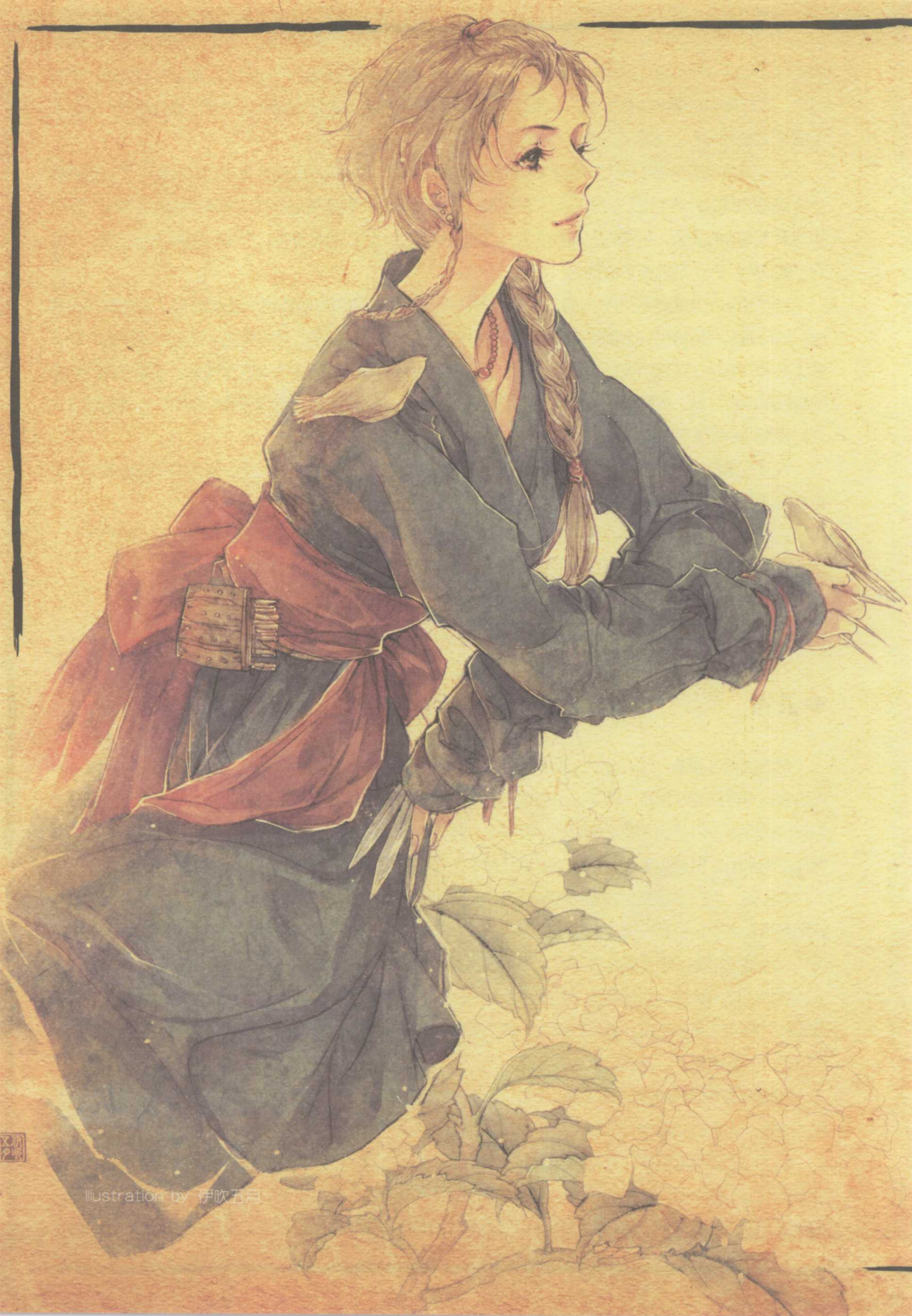
Illustration by 伊吹五月