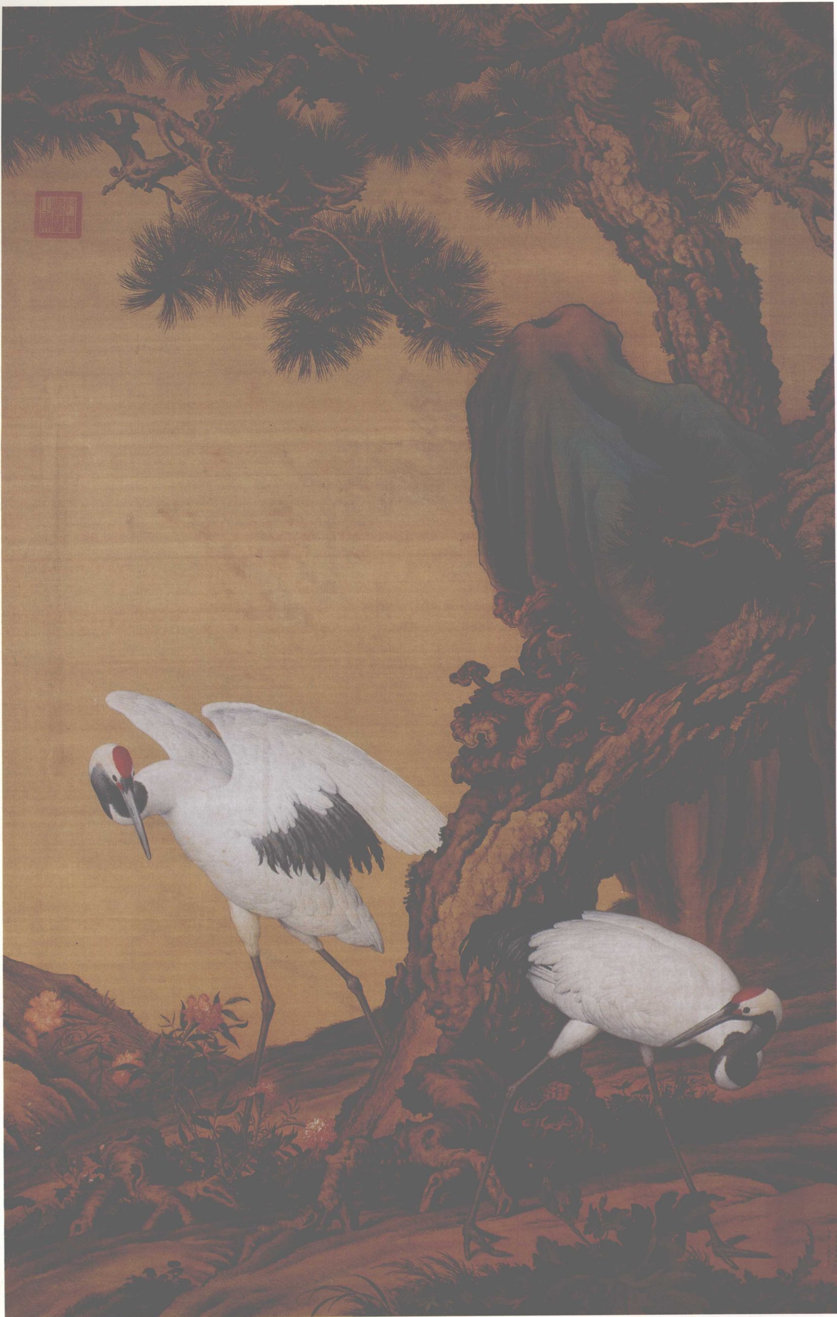
松鹤图 沈阳故宫博物院藏