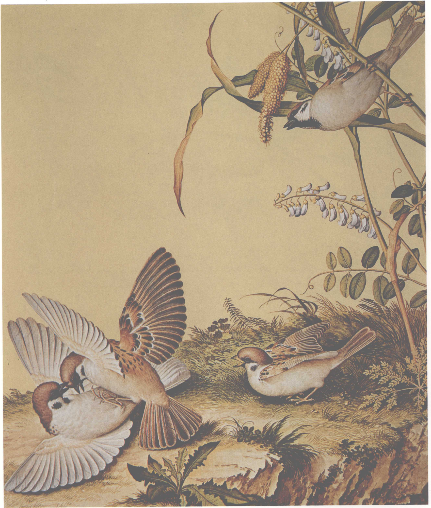
仙萼长春图——谷花稷穗