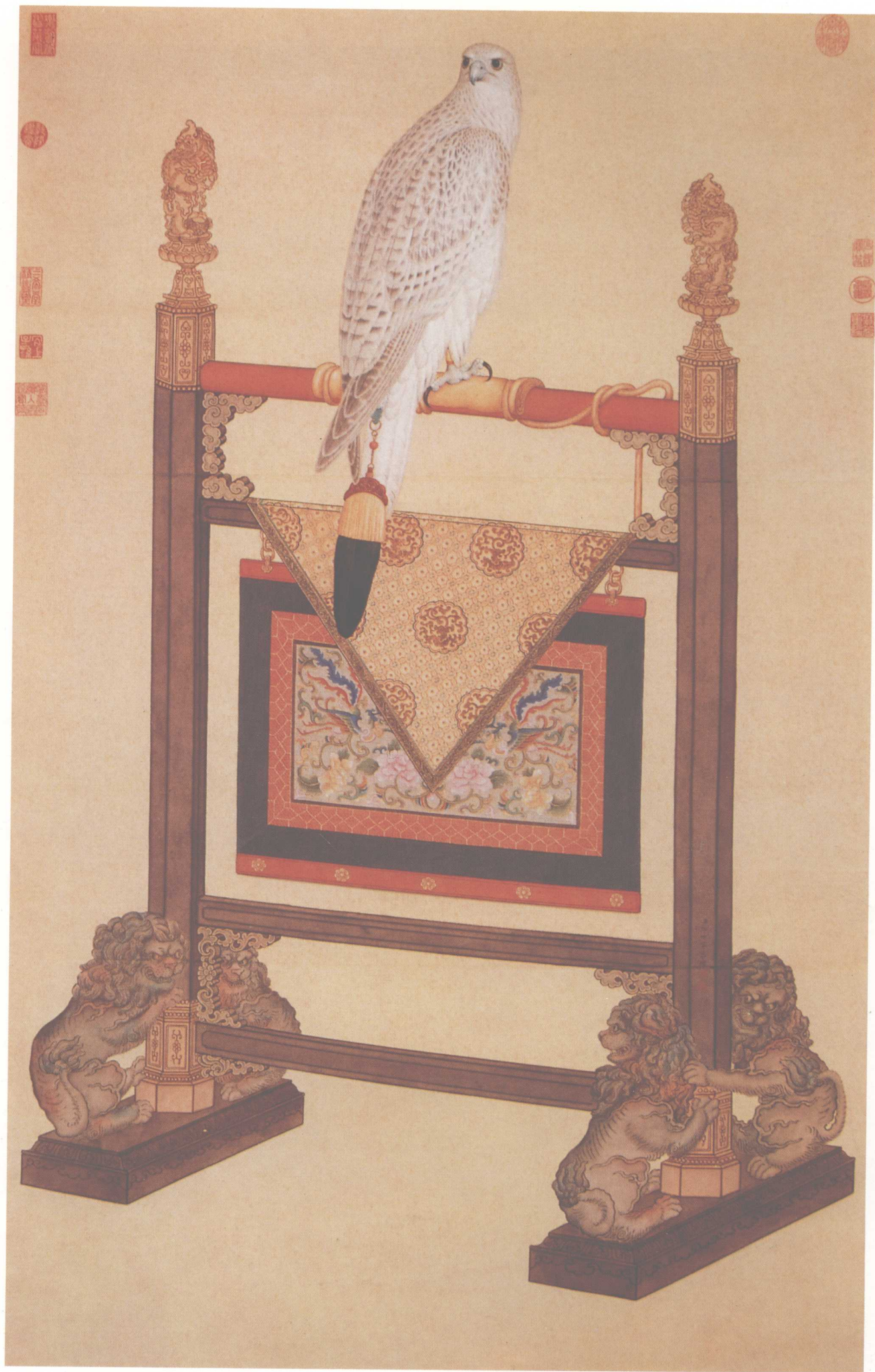
白海青图 台北故宫博物院藏