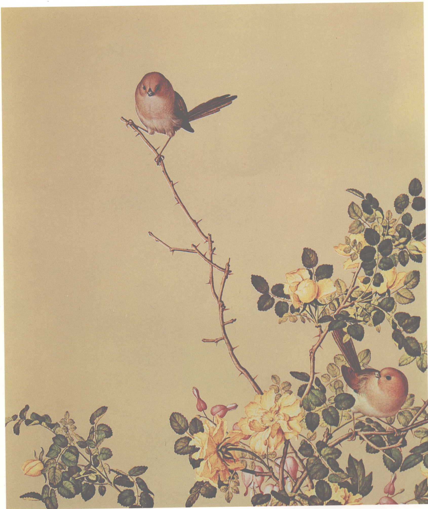
仙萼长春图——黄刺糜鱼牡丹