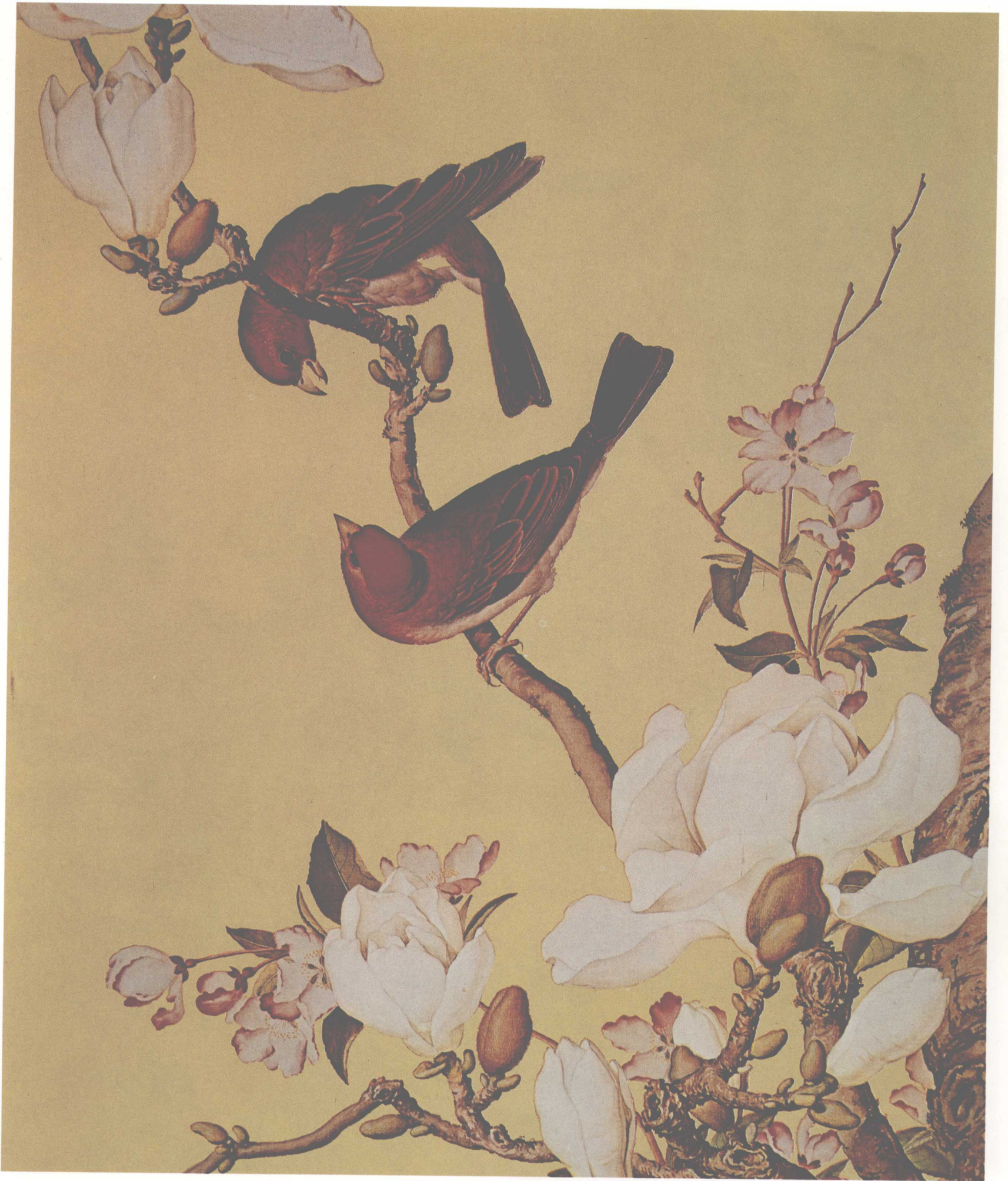
仙萼长春图——海棠玉兰