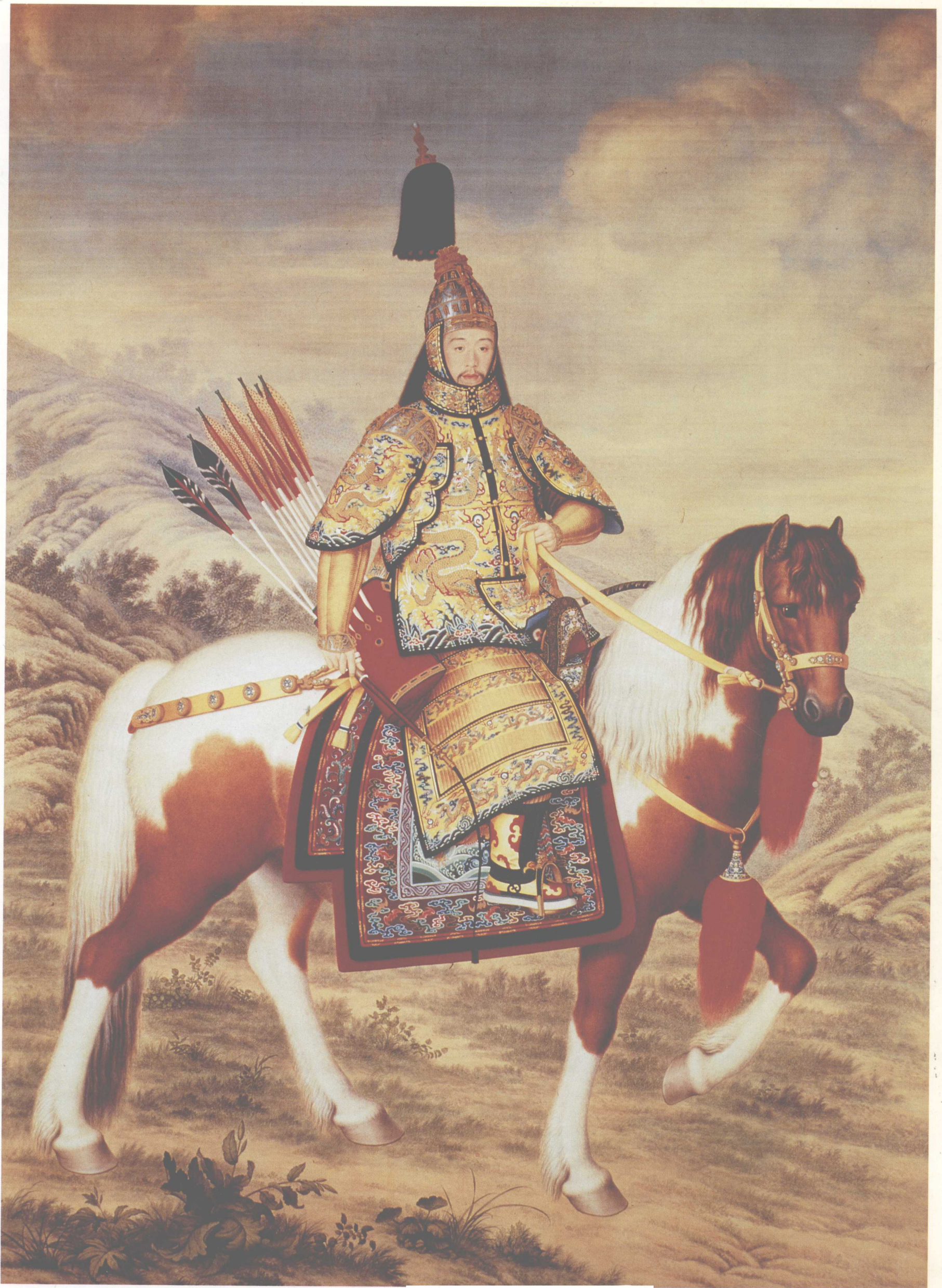
大阅图 北京故宫博物院藏