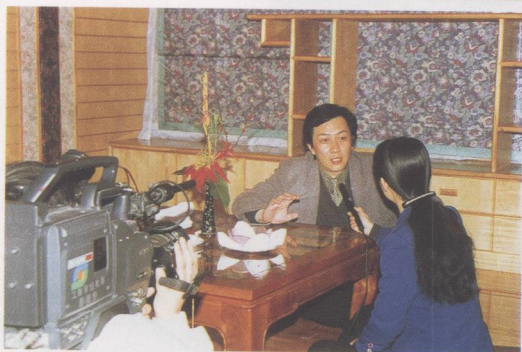
① 昔日“小花哥”今日“诸葛” ——访著名演员唐国强