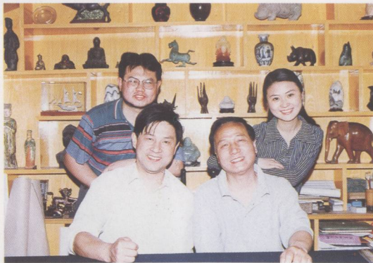
① 原中央电视台副台长、总编辑洪民生与摄制组合影 (前排右)