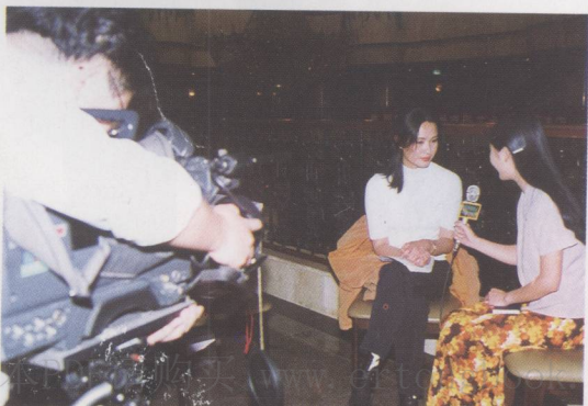
① 方舒说：“我是一个很幸运 “试读”结束，需要全