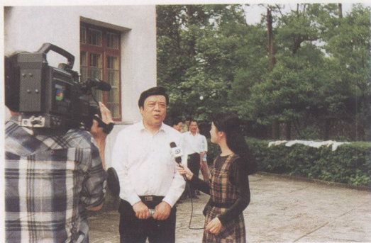
● 赵忠祥的“岁月随想”……