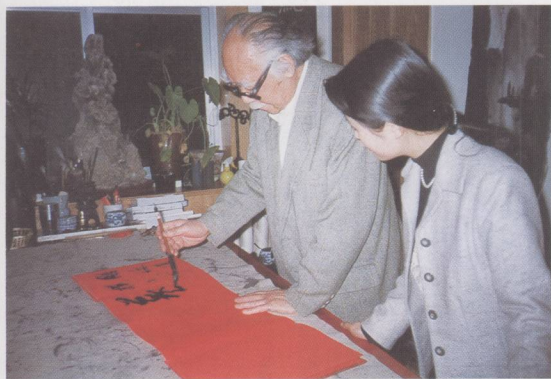
① 著名导演凌子风为系列片 题词