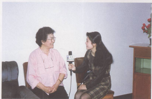
① 朴实的大妈——赵丽蓉