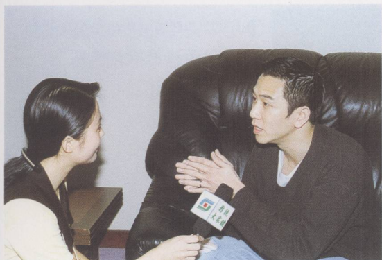
① 打算四十岁“退休”的温兆伦