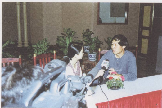
① 导演韩刚畅谈“导演经”