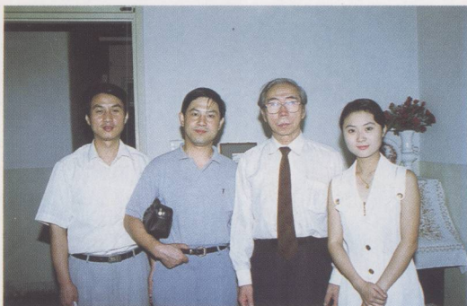
① 访著名影视作曲家吕远 (左起第三位)