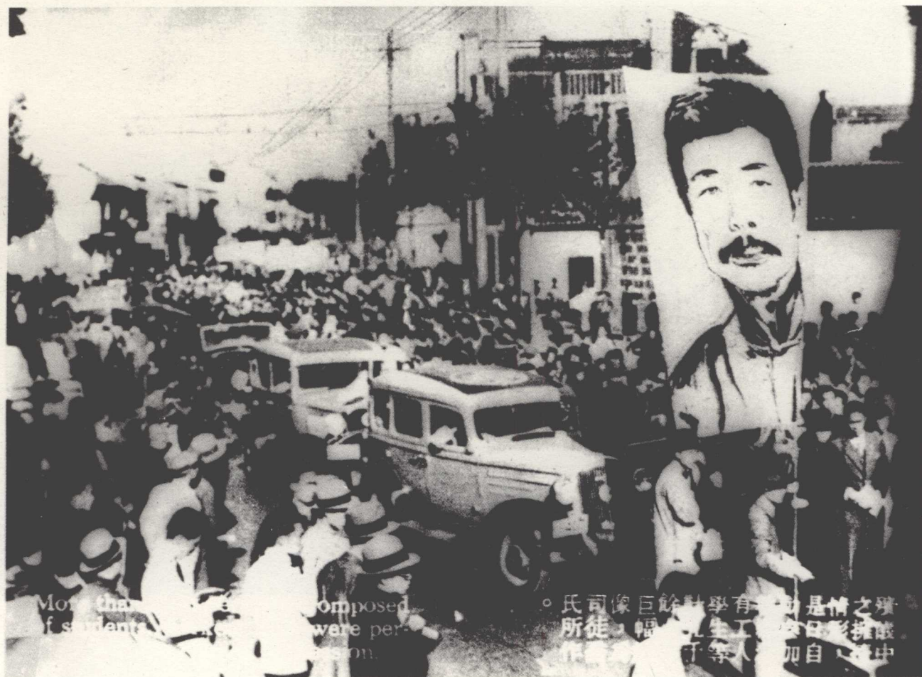
8 鲁迅先生殡仪。大幅画像是司徒乔的作品