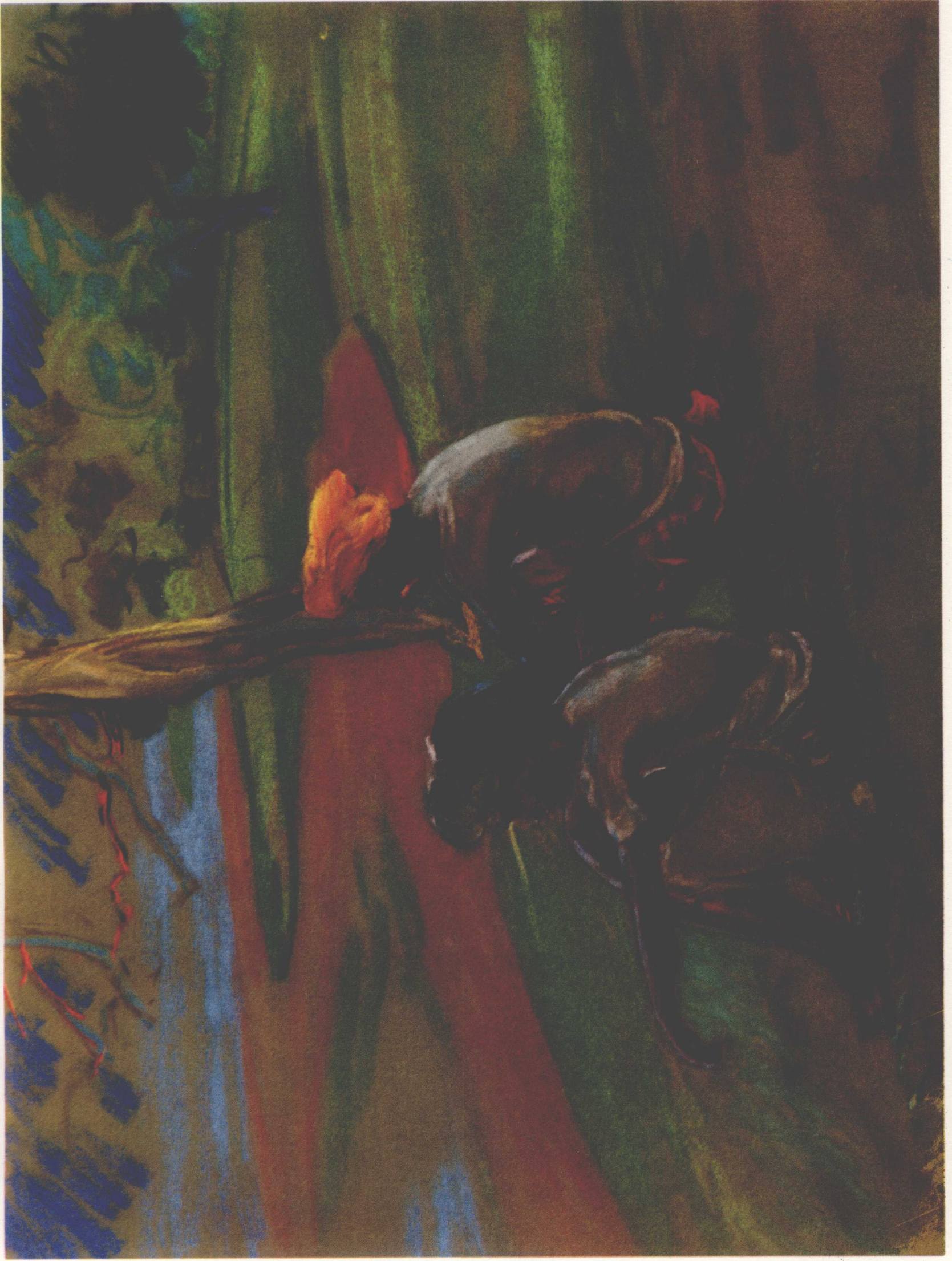
10 莱雅湖上的清洁工人