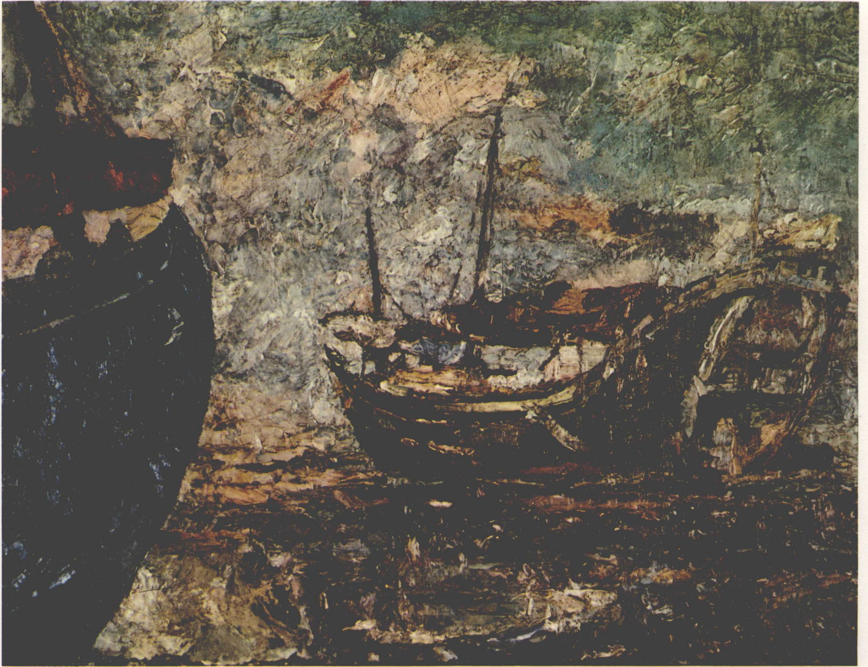
4 搁 浅