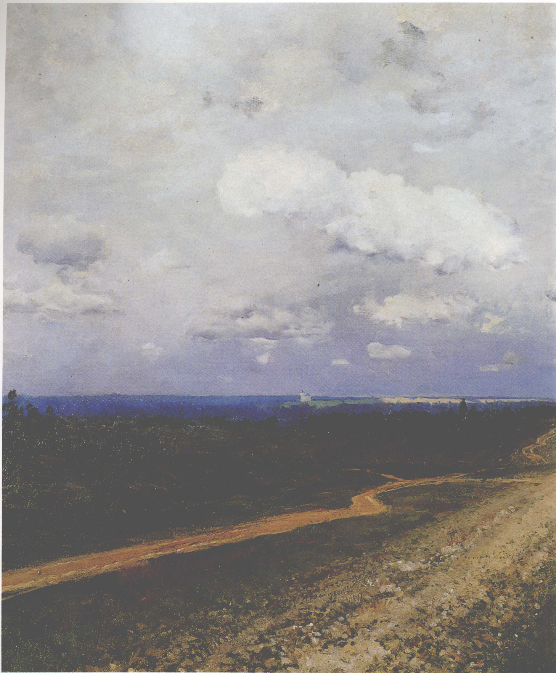
符拉季米尔路 1882年 79cm×123cm