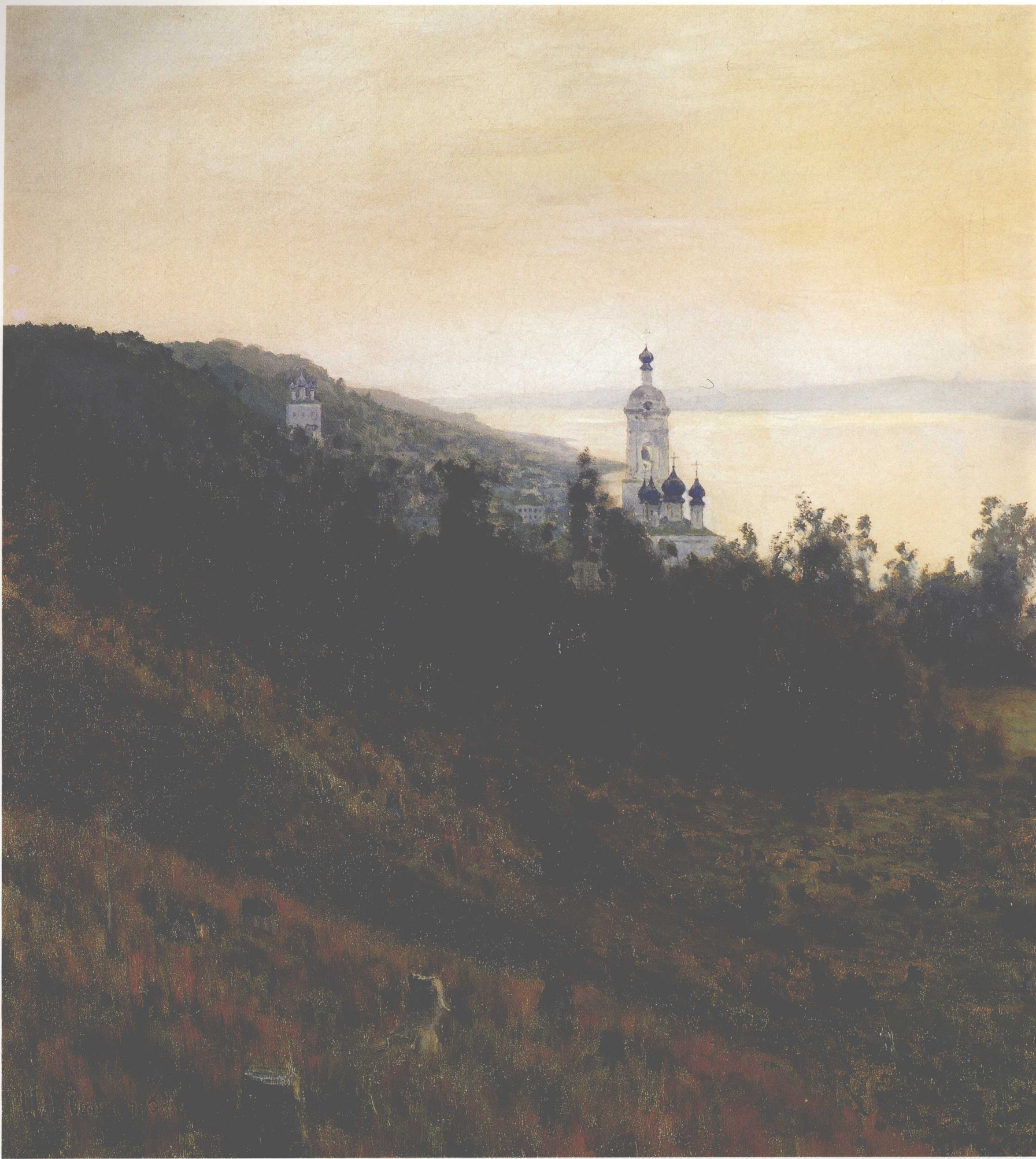
黄昏·金光粼粼的河面 1889年 84.2cm × 142cm