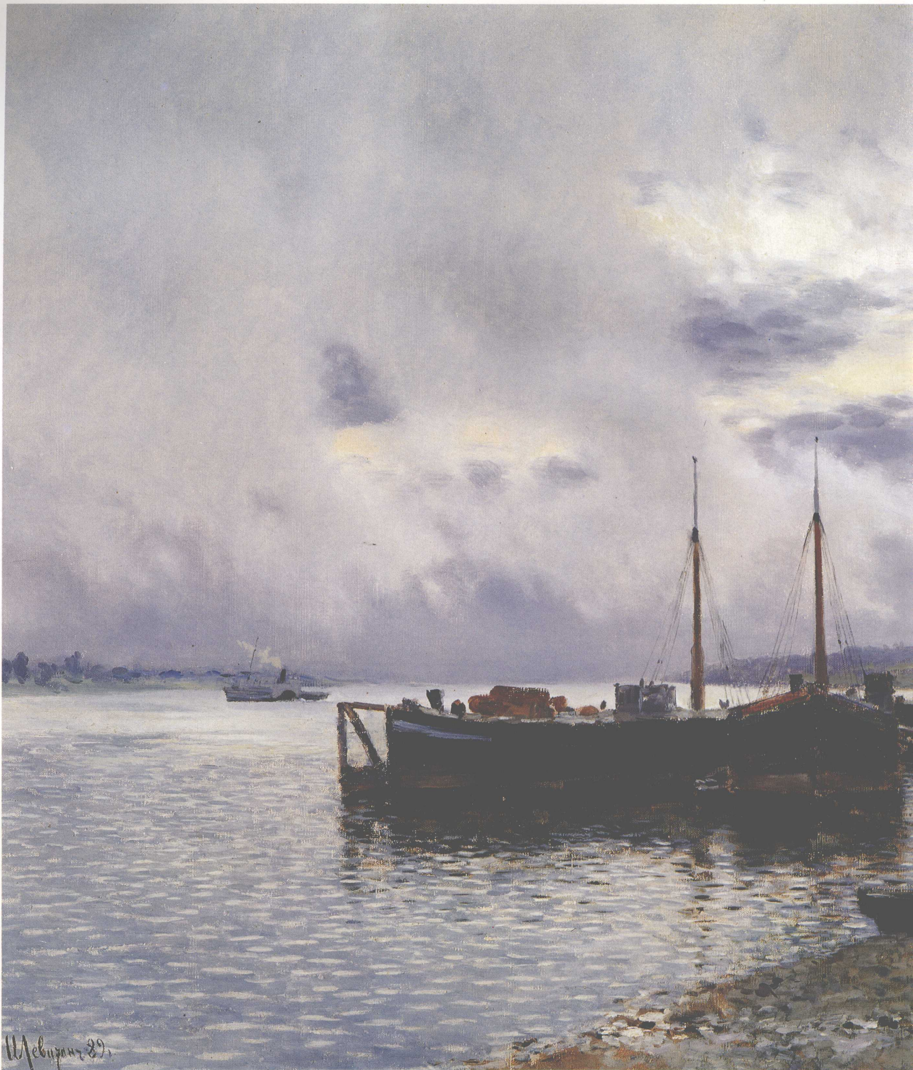
雨后·河塘 1889年 80cm × 125cm