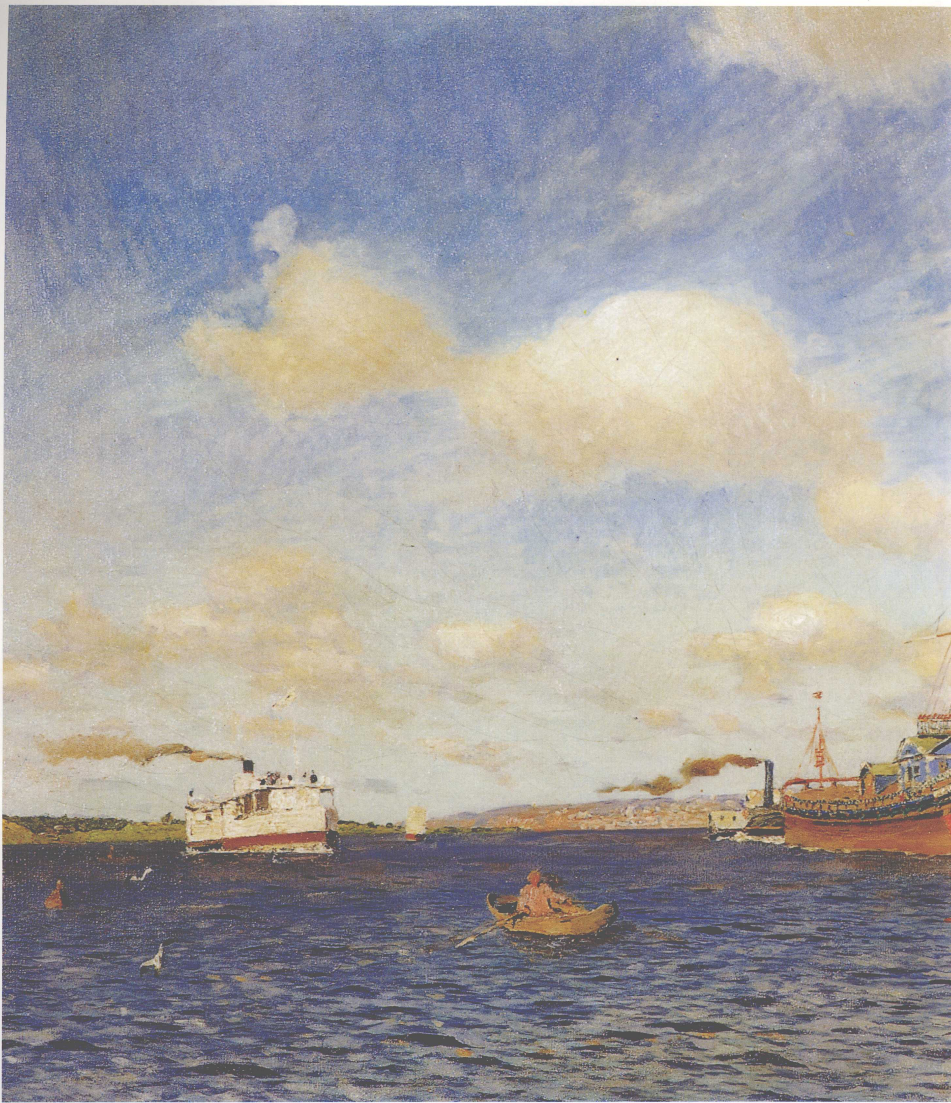
伏尔加河上的清风 72cm×123cm