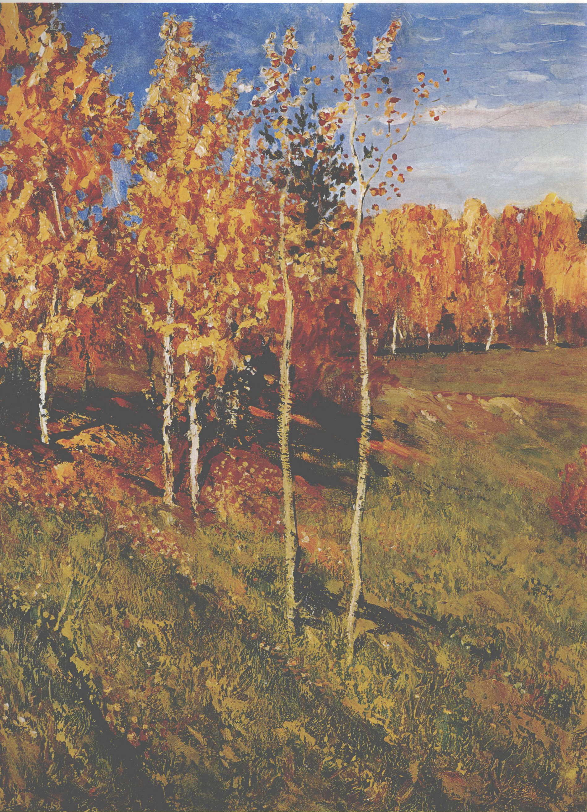
金色的秋天 1895年 82cm × 126cm