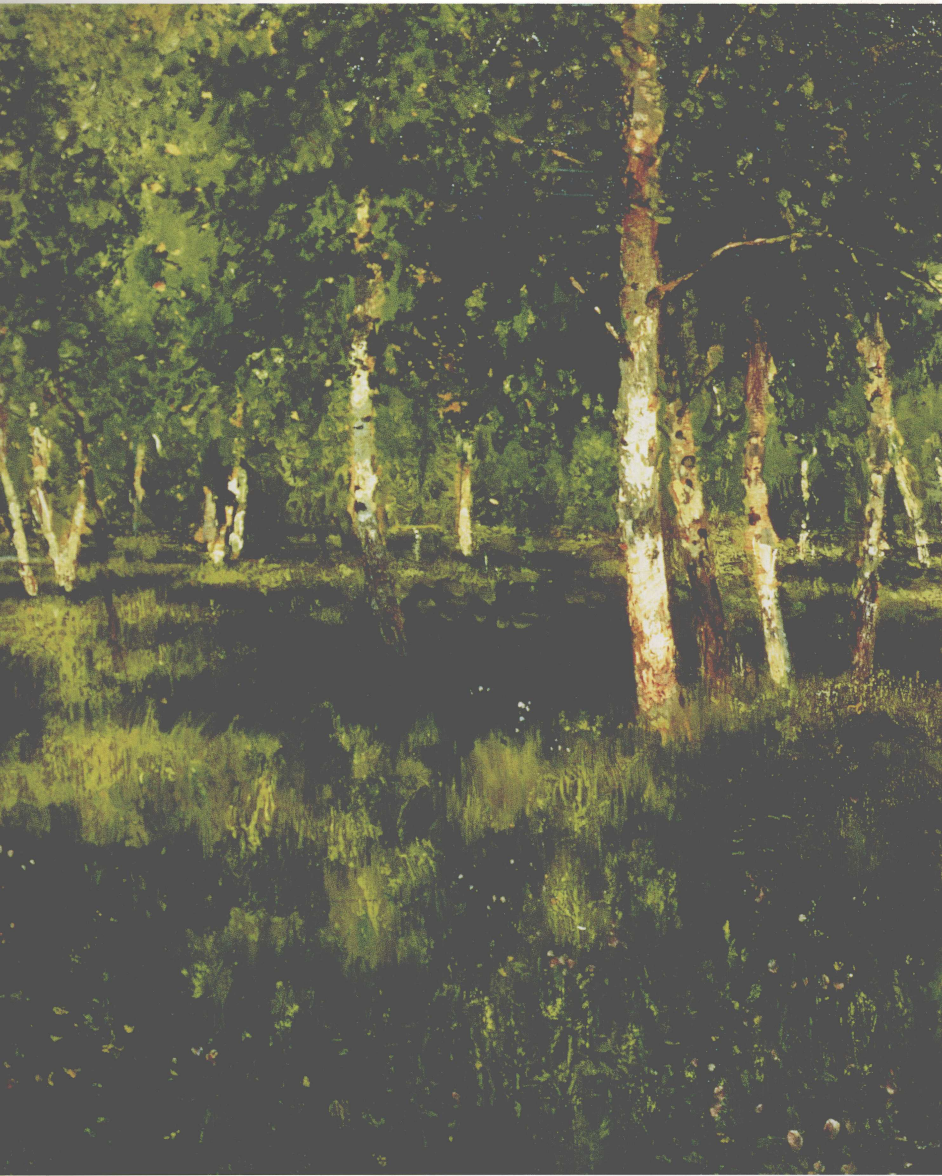
白桦丛 1888 年