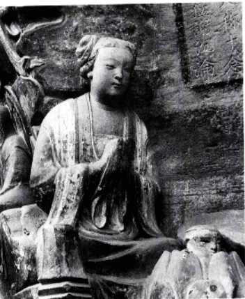
宝顶山石刻女供养人