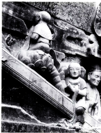
宝顶山第18号摩崖荷叶、骑栏童子