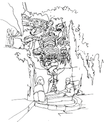
宝顶山九龙浴太子线图

崖造像,除却风化剥蚀的以外,明确可数的造像约有一千五百多躯。其中有十九组主要的佛经故事雕像。第2号“护法神像”;第3号“六道轮回图”;第4号“广大宝楼阁”;第5号“华严三圣”像;第8号“千手观音”像;第11号“释迦涅槃圣迹图”;第12号“释迦降生图”;第13号“孔雀明王经变相”;第14号“毗卢道场”;第15号“父母恩重经变相”;第18号“观无量寿佛经变相”;第19号“六耗图”;第20号“地狱变相”;第21号“柳本尊行化道场”;第22号“明王、金刚”像;第29号“圆觉洞”;第30号“牧牛道场”。这些佛经故事雕刻,连成一部描写佛之生与死、父母恩重与报恩、天堂与地狱、苦行修炼成佛等宗教主义一脉相连的连环雕刻巨制,其组织规模之严整与变化是国内少有的。