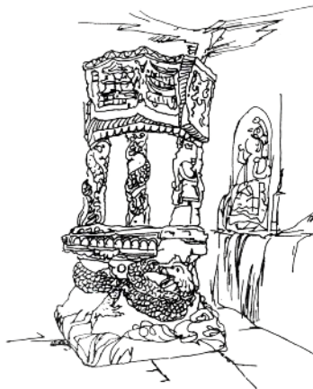
北山第136号窟心神车线图