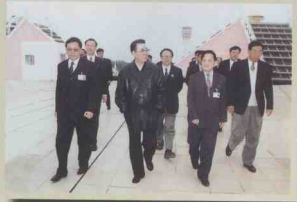
1999年2月2日，李鹏委员长视察美兰机场。