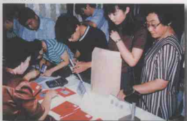
《国有土地使用证》发证现场。