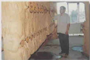
海南果蔬食品配送有限公司加工、冷藏库工作间。