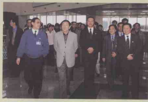
1998年12月20日，朱镕基总理视察美兰机场。