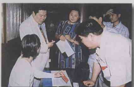
现场咨询服务，促进庄园开发。