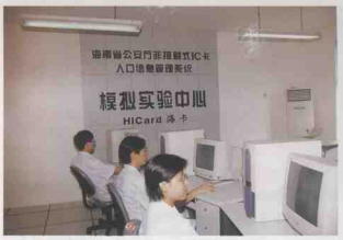
设备现代化、人员素质高、数据详全的系统模拟实验中心。