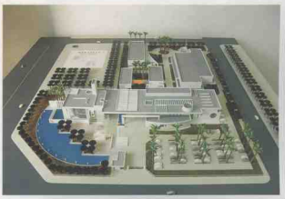
海卡公司正在筹建海南省重点项目——具有国际一流水准的海南信息产业生产基地。