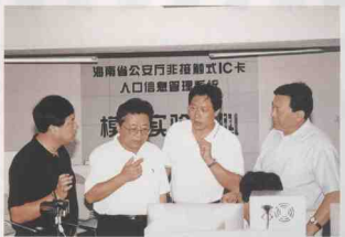
全国人大常委会委员、原海南省委书记、省长阮崇武(左二)视察海卡公司模拟实验中心。