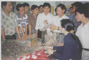
省供销社合作联社聘请专家在给学员讲授农药配方和防治病虫害知识。