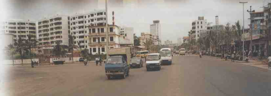
海口美兰机场出口大道。