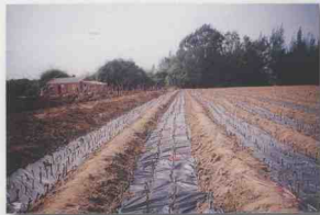
省供销社合作联社儋州葡萄基地。