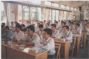
省供销社合作联社对职工进行岗位培训。