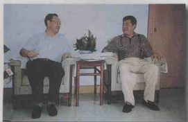
省委书记、省人大主任杜青林与总经理张泰超畅谈庄园前景。