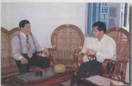
亲切交谈，共商大计。