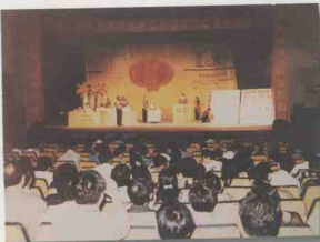
海口市地税消费发票抽奖开奖仪式。