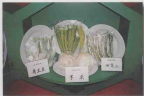
省供销社合作联社在冬交会展示的海南冬季果菜。