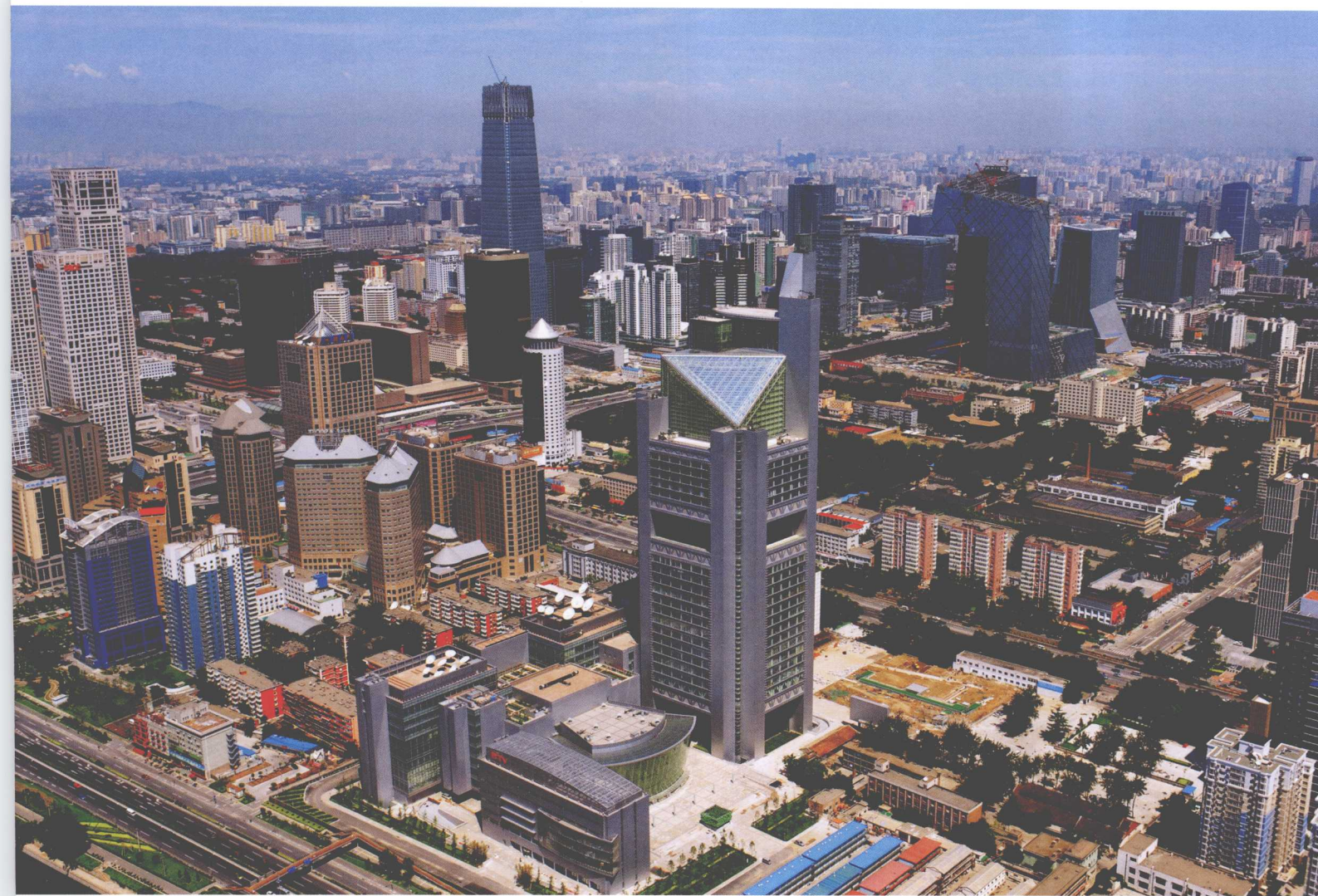
◎ 北京市商务中心区