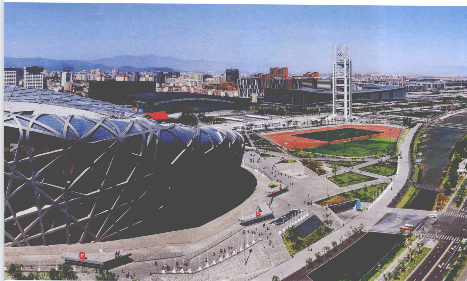
◎ 北京市国家体育场（鸟巢）俯拍全景