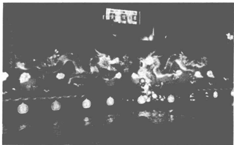
图1 南京秦淮河元宵节夜景

运河沟通了海河、黄河、淮河、长江、钱塘江五大水系，有力地促进了全国特别是维扬地区经济与文化的发展，所谓“北通涿郡之渔商，南运江都之转输，其为利也博哉！”（皮日休《汴河铭》）兴化的米酒，选用