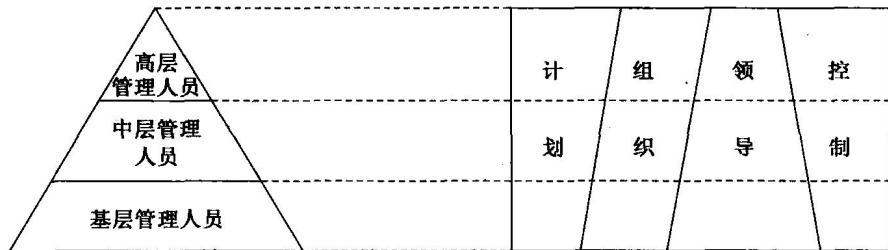
图 1.1 不同管理层次的管理职能