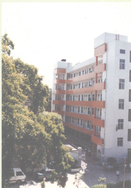
女生宿舍区公寓楼

五年来，由国家拨款和学校自筹资金 3500 多万元，增建了化学实验楼、女生公寓楼、教工住宅楼群和综合办公楼，面积达 24000 平方米，还添置了大批现代化教学设施。今天的海中校园，绿树成荫，芳草如茵，水泥校道宽阔笔直，四通八达，一幢幢现代化楼宇和仿古建筑相映成趣。