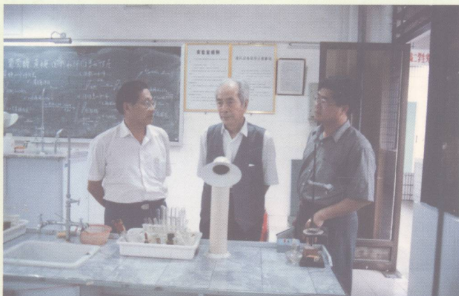
◀原教育部副部长、全国关工委副主任张文松(中)在省教育厅厅长符鸿合(左)陪同下来我校检查工作。(1996年)