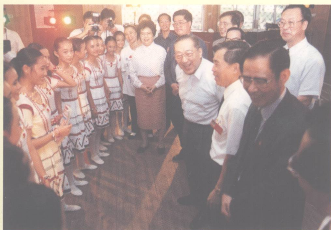
李副总理在观看校文工团演出后同小演员们亲切交谈