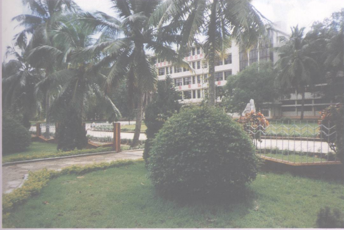
教学楼前绿树成荫、芳草如茵