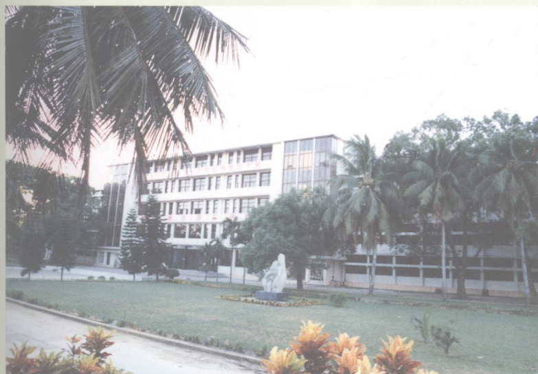
绿荫簇拥的教学大楼