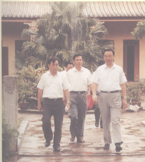
省委书记杜青林(右一)来校视察