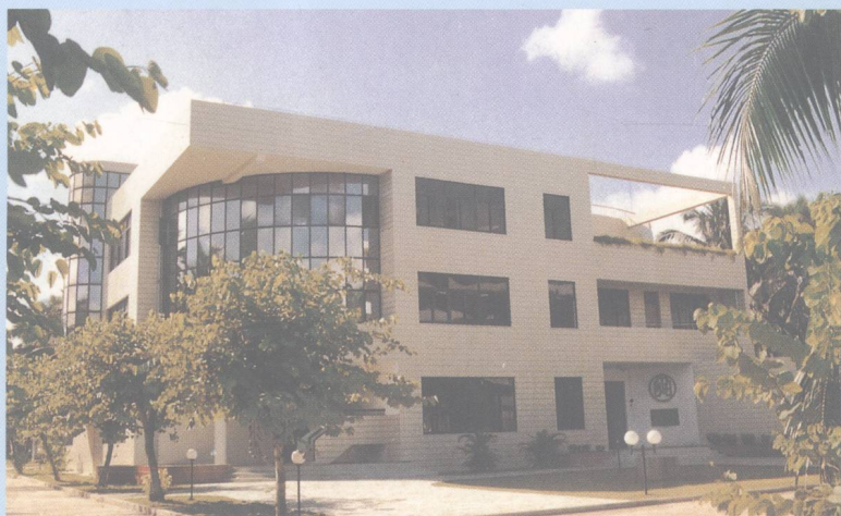
造型别致的艺术楼