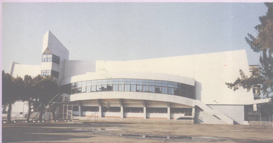
三年前建成的多功能体育馆，建筑面积3655平方米。1996年全国青少年技巧锦标赛曾在这里举行。