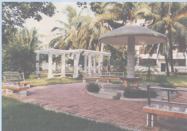
形态各异的凉亭给校园增添了无限情趣