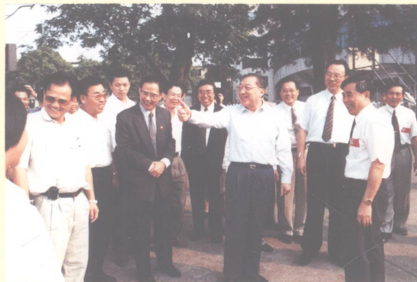
李副总理视察校园，谈笑风生