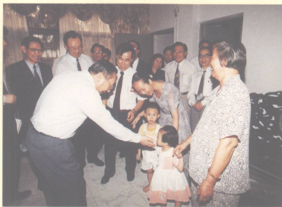
李副总理来到教师家里向教师家属问寒问暖