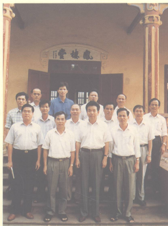
原副省长刘名启(前右二)来校检查工作，同校领导及中层干部合影