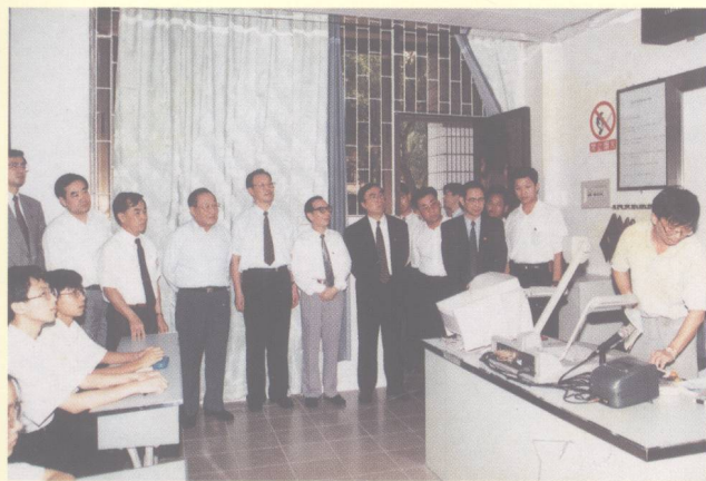
李副总理等察看我校化学多媒体教室