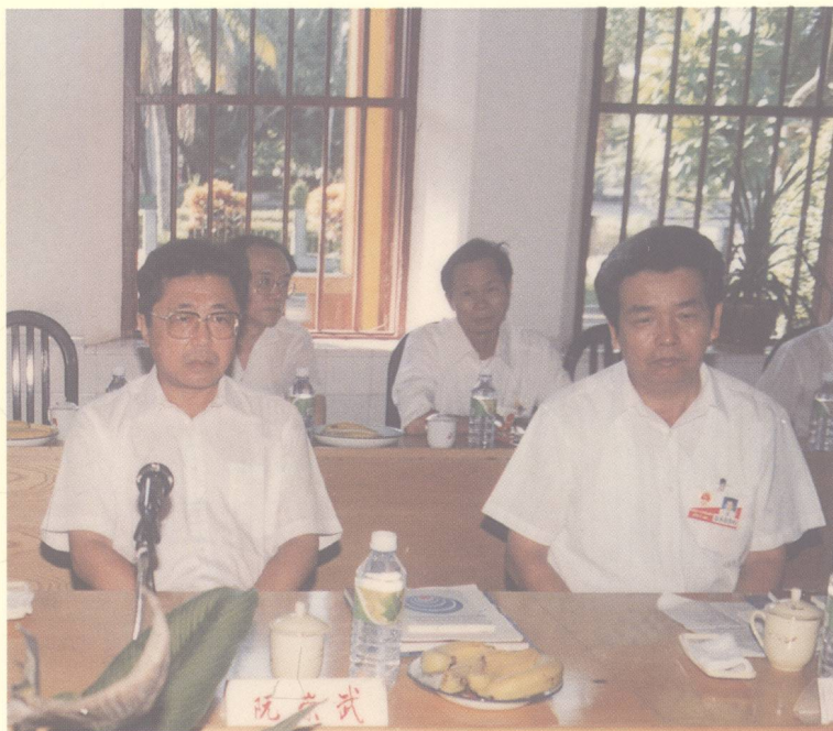
原海南省委书记、省长阮崇武(左一)来校视察