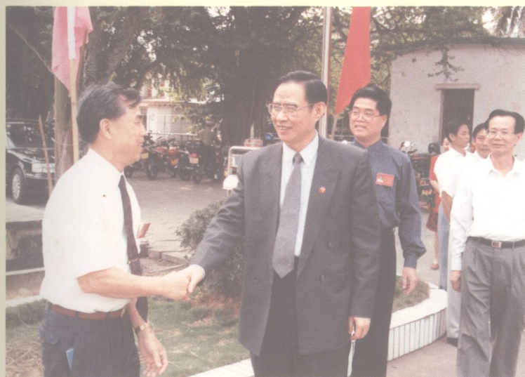
省委副书记、常务副省长王厚宏(中)来校检查工作