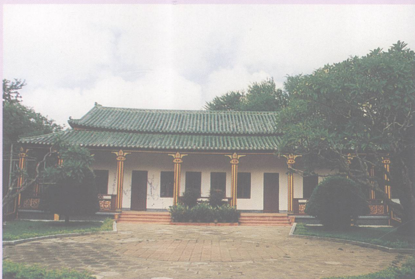
建于30年代的风栖堂，经过重修，结构规模依旧而色调清新。