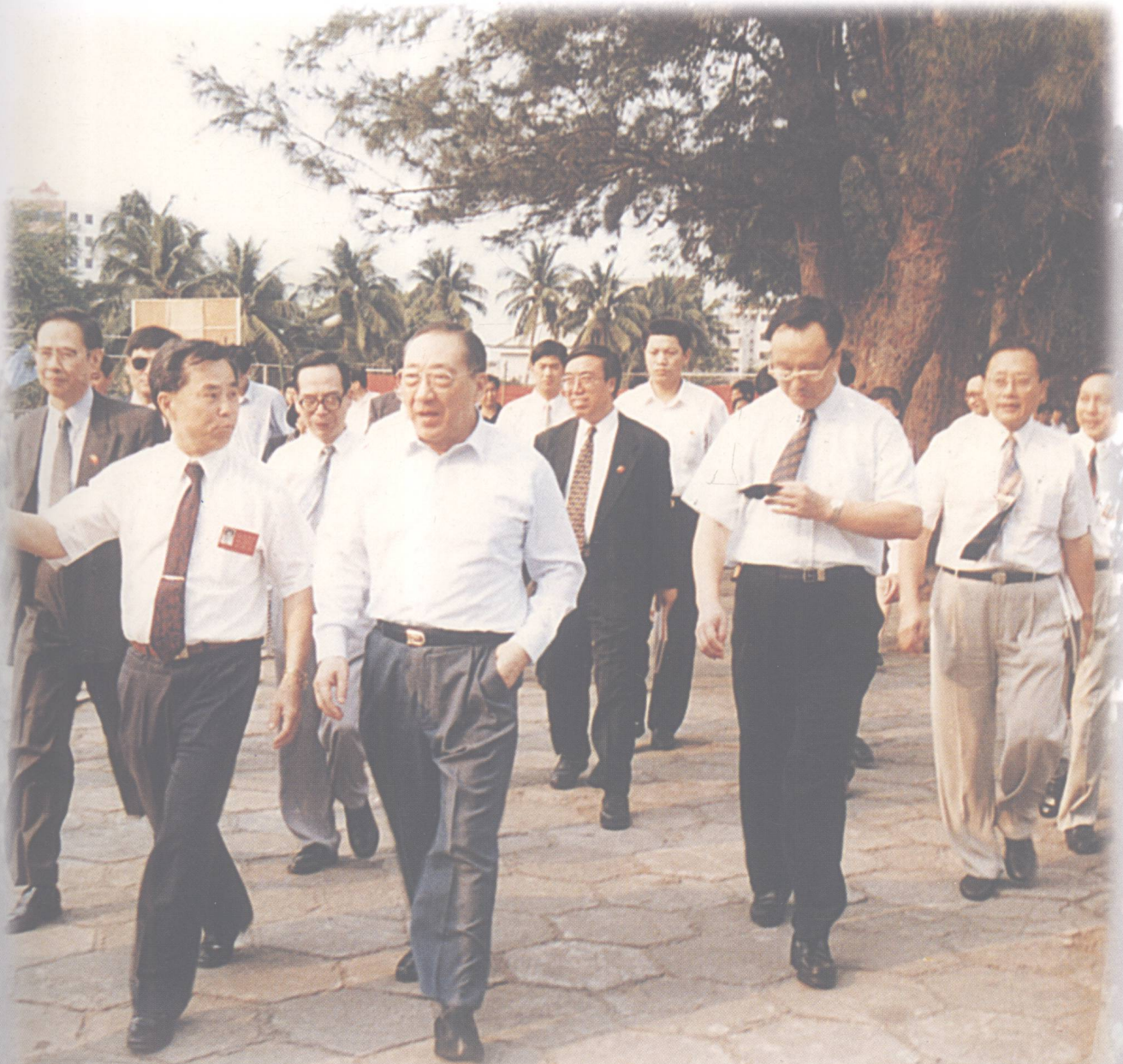
邹福如校长带领李岚清副总理等视察校园。