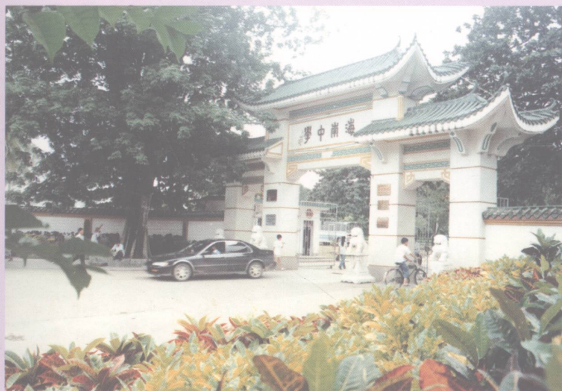
学校大门，建于30年代，1988年重修