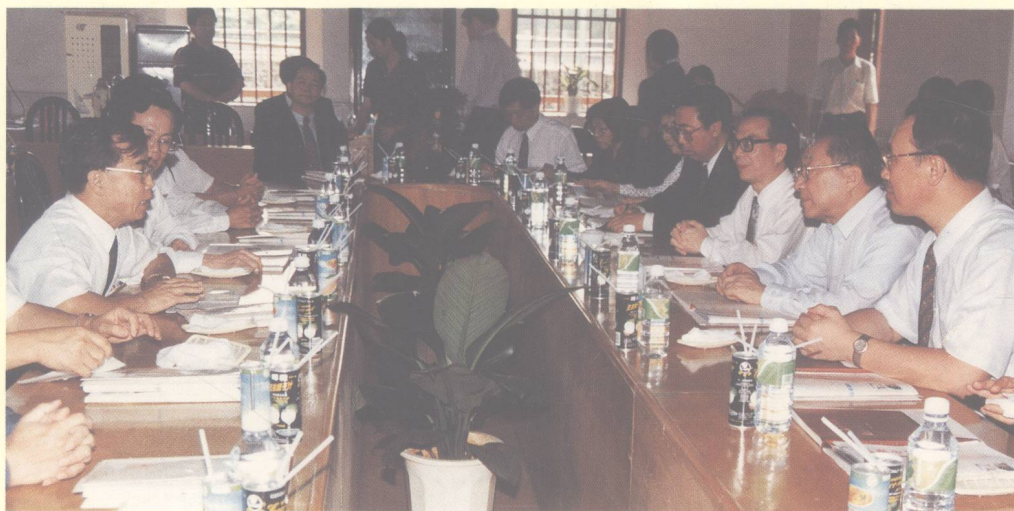
邹福如校长向李副总理等汇报学校工作