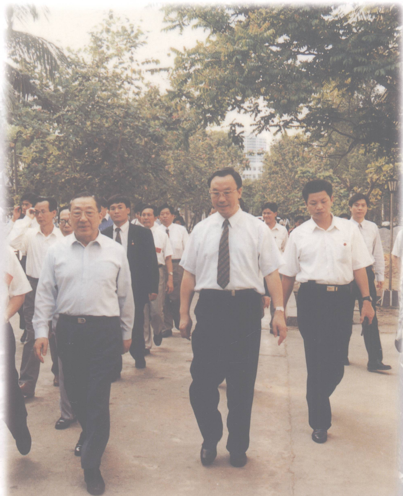
1998年4月11日下午，中共中央政治局常委、国务院副总理李岚清在海南省委书记杜青林等的陪同下来我校视察。