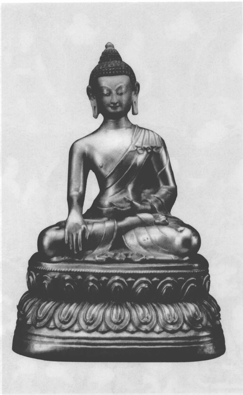
● 释迦牟尼（16—17世纪，铜鎏金，彩绘）