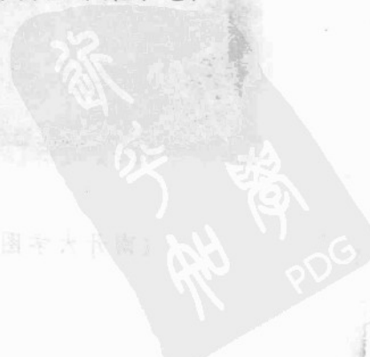
饶应祺代拟的左宗棠函稿(“照缮”二字及删改文字为左宗棠手笔)