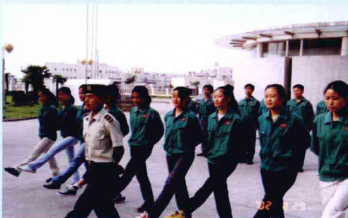
培训班学员在步操训练中