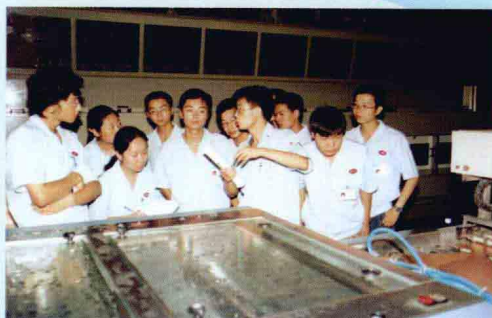
教师在车间现场给学员上课