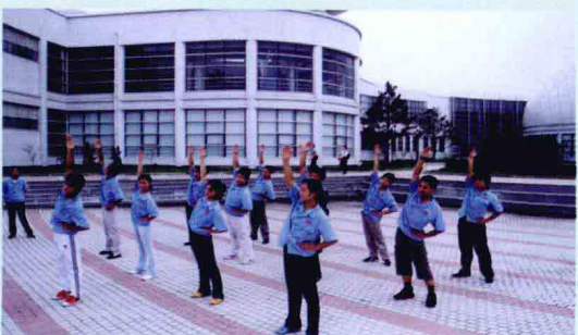
培训班学员在举行晨操团体赛