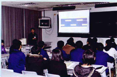
教师在给学员上课