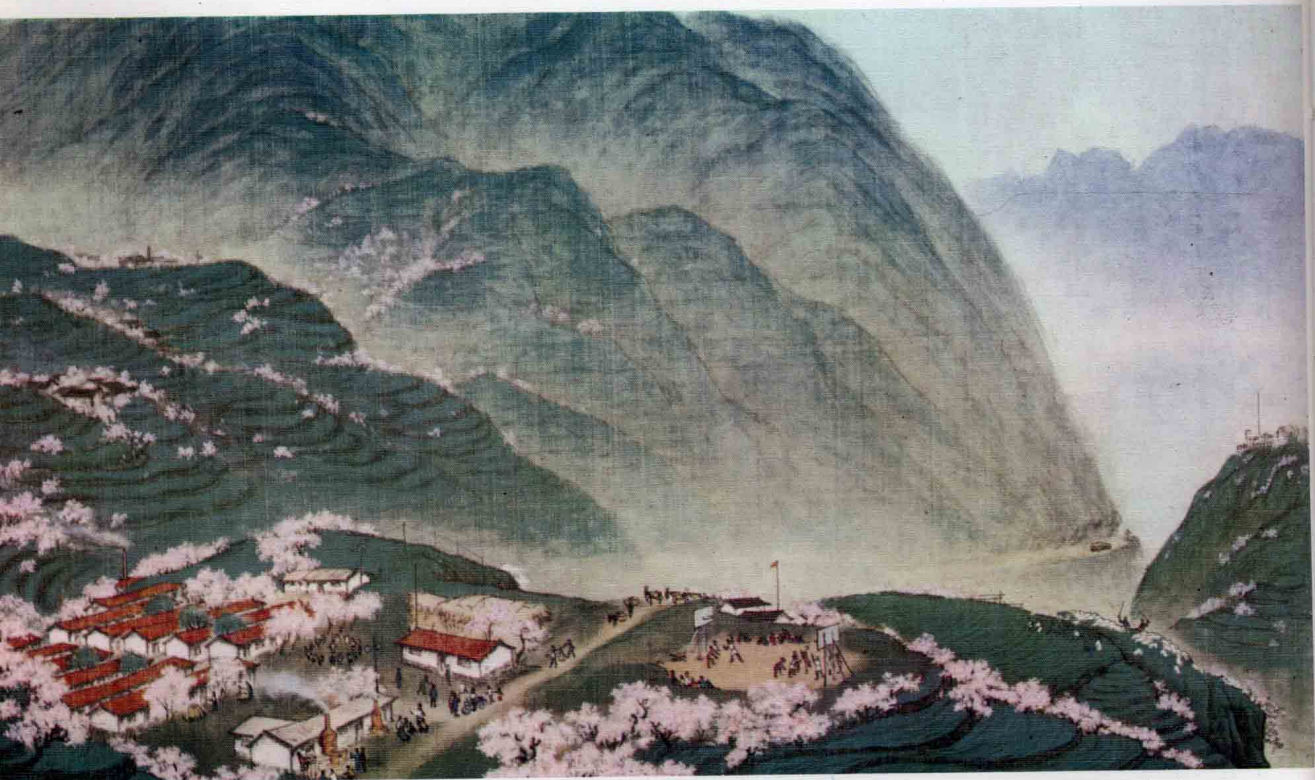
6 百花山 1959 中国美术馆收藏