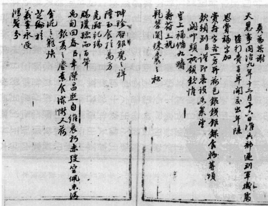
左宗棠谢折抄件(湖南省社会科学院图书馆藏)