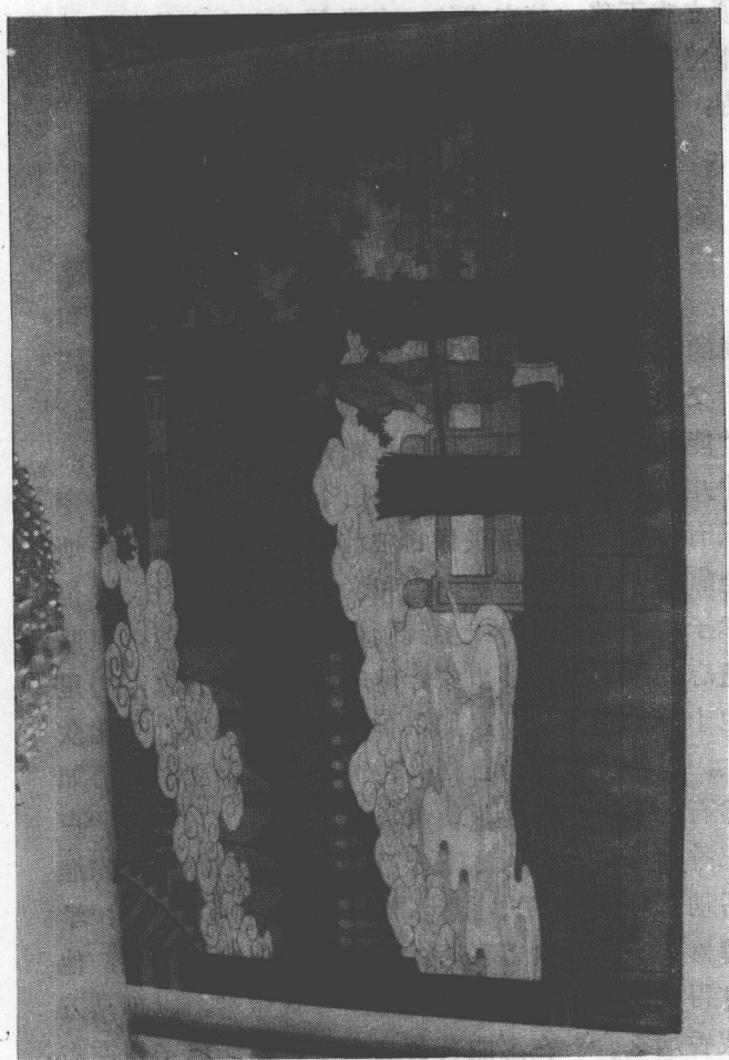
金台寺听诵《金刚经》

滑宝来意，口空入一，尚麻岂寒出长不，即费解亦 必至，神同。行木有武人案滑耕道殿坐，正坐发团