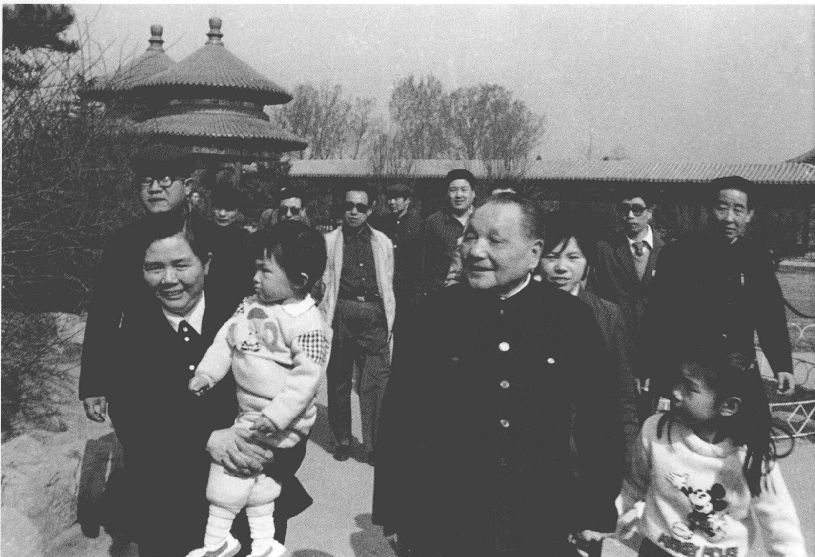
邓小平同志漫步天坛公园（1987年）