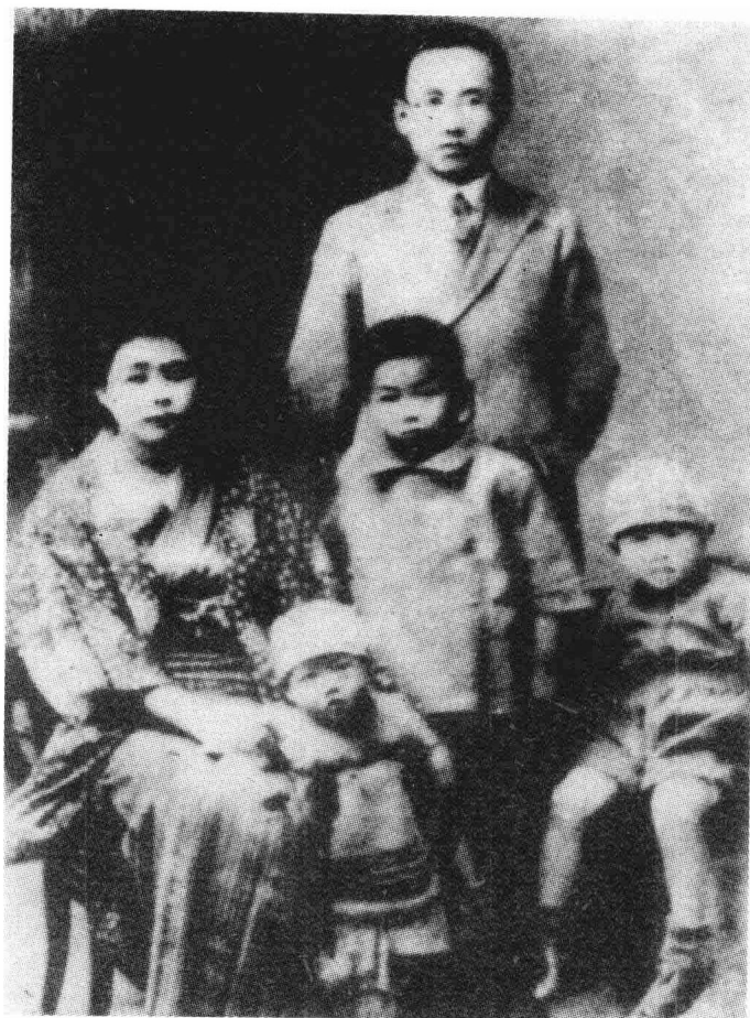
1933年郭沫若在日本时的全家合影