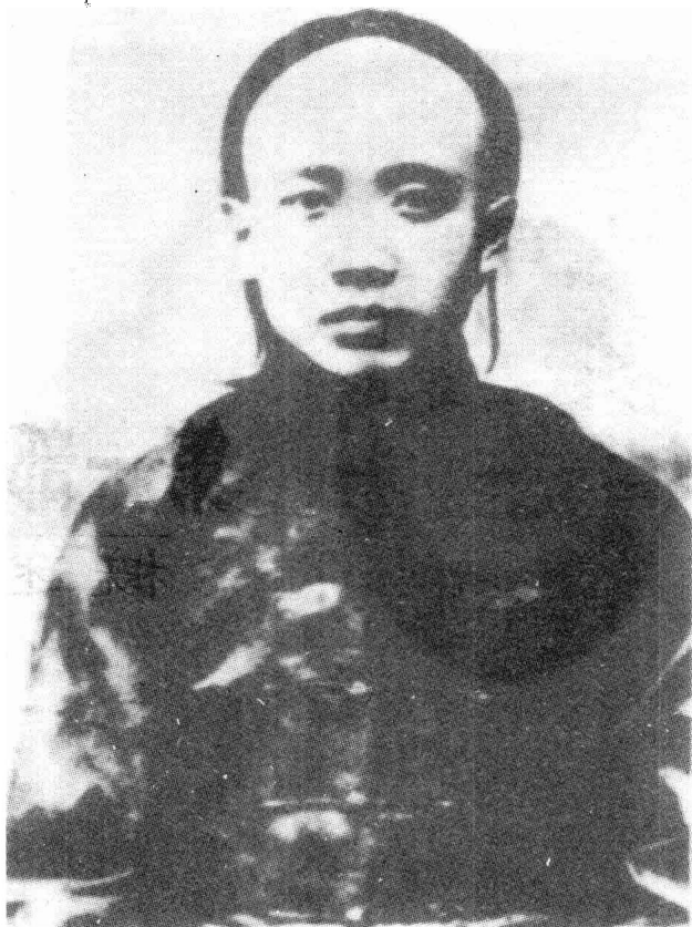
1910年郭沫若摄于乐山