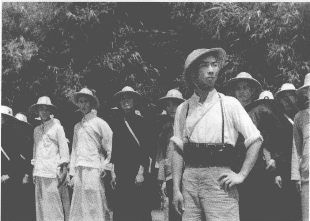
■ 地不分南北，人不分老幼，皆有守土抗战之责——在汉口接受军事训练的中国普通百姓。

然而世事无常，风水轮换，和十年前一样，随着国民政府的西迁，武汉在1937年底又迅速成为中国抗战的核心。三山五寨各路人马齐汇武汉，共谋抗战大计。12月，中