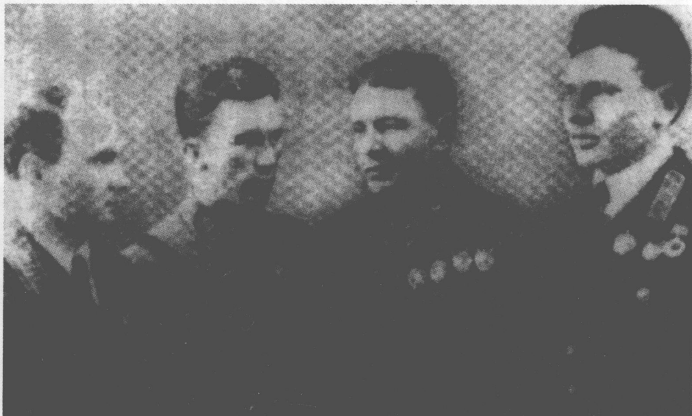
■ 1937年11月，苏联志愿航空队先遣人员抵达武汉。

此外，列强虽然对卷入中国抗战并不热心，但对日本人的扩张十分警惕。英、美、法纷纷增加武汉租界防卫力量，举行防务演