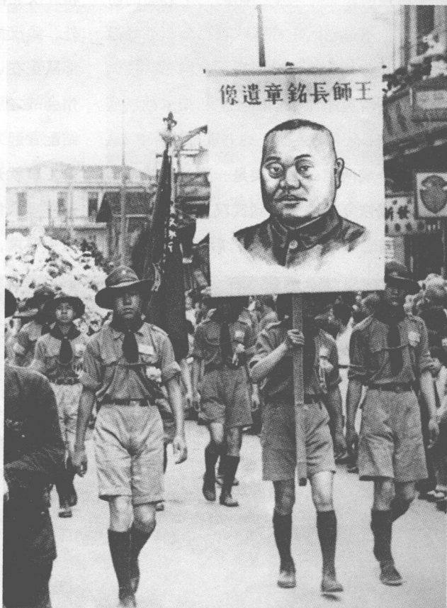
■ 台儿庄会战中牺牲在滕县的川军将领王铭章将军的葬礼在汉口举行，童子军高举王将军遗像引导花圈灵车。

令。之后，他先后出任第11师师长和第18军军长，以此开始组织起自己的嫡系力量——“土木系”（十一合为土，十八合为木）。他在中原大战和“围剿”红军中几度沉浮之后，于1935年担任军委会委员长行营陆军整理处处长，以应对未来中日战争为目标，整顿部队。七七事变爆发后，他担任庐山军官训练团副团长，负责高级军官轮训，随后又返回南京参与制订抗战计划。八一三事变爆发后，他出任第三战区前线总指挥兼第15集