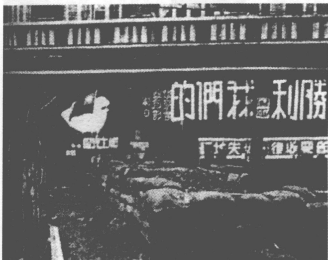
■ 武汉的街垒和抗战标语。

浙江后调湖北麻城；第二类是整训补充后立即投入新的战线，如第71军在洛阳后调豫东参加作战），因此武汉周边地区并未能集结足够的部队。当时隶属武汉卫戍司令部的部队仅有第54、94军共4个师的兵力。在皖中地区是徐源泉的第26集团军（4个师），在安徽的江北岸是杨森的第27集团军（2个师）。长江南岸皖南一带有第23集团军（6个师，但还在整理补充中），马当、彭泽、湖口一带是海军陆战队和新成立的江防军（7个师）。大别山一带和武汉北段的平汉线尚未配置有力部队。此外，武汉周边有一些军事委员会直属的预备部队正在进行整训。这种情况一直持续到徐州会战之后相当长一段时间。在部队充分集结配置起来之前，在武汉附近和外围修筑防御工事就开始了。根据1937年11月29日的行营军事会议的要求，武汉附近以防御东面来敌为要求，在贺胜桥—豹子獾（即梁子湖）—