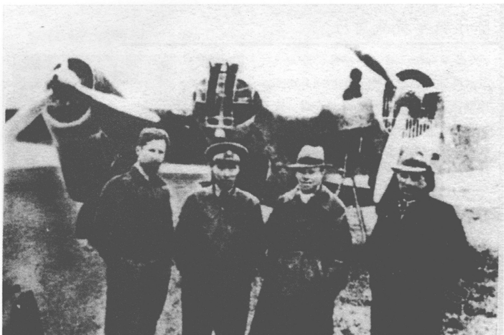
■ 苏联援华航空队人员在汉口机场合影。

工事，并由军令部派出人员负责指导监筑。蒋介石特别指出“马当、湖口、九江、田家镇防务特别重要，其工事与炮位以及部队防务，应由军令部特别督促布置”。到当年夏天，有一些整补完成的部队并没有直接投入前线，而是先行调集到上述地区构筑防御阵地。