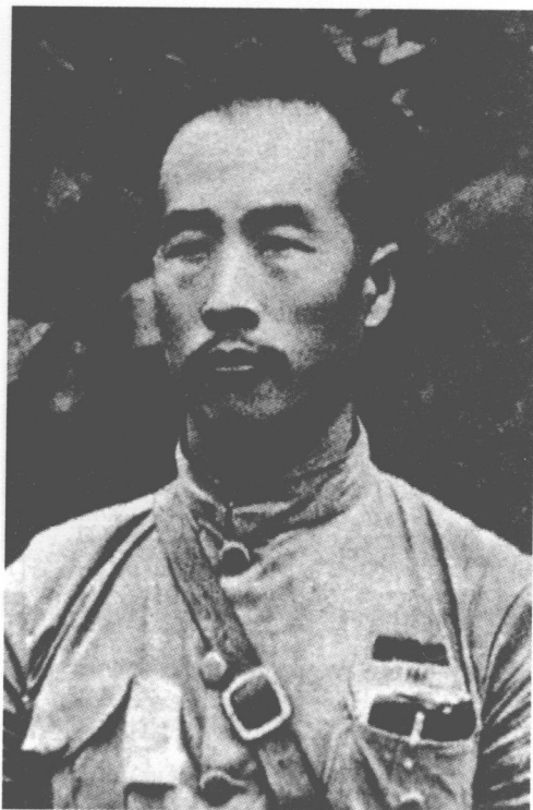
■ 第五战区副司令长官兼第3集团军总司令韩复榘上将。

共中央派出周恩来、王明、博古、叶剑英等人组成的代表团抵达武汉，与国民政府就两党合作的组织形式和共同纲领进行商讨。社会名流、著名政治活动人士如沈钧儒、郭沫若、邹韬奋等人也纷纷抵达武汉，成立民众抗日政治团体，宣传抗日，出版抗日刊物。