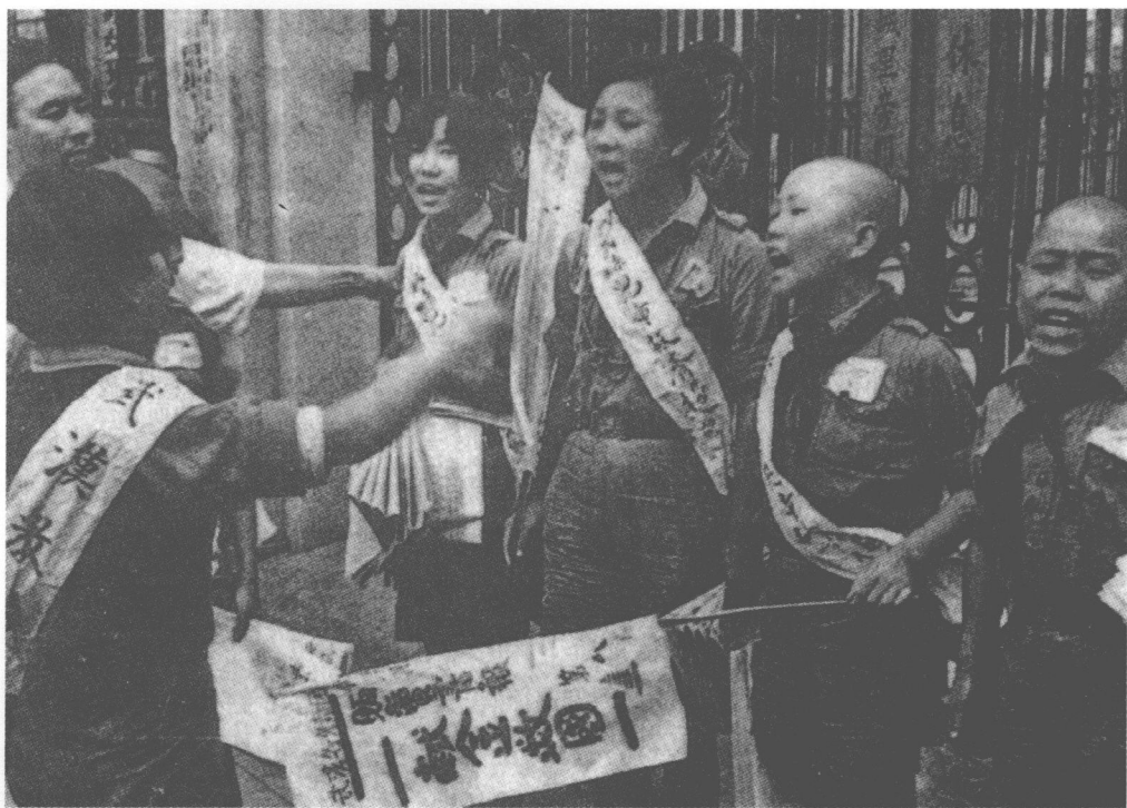
■ 在武汉街头宣传献金救国的儿童。

将来之主战场也”。在此，国民政府军事决策机构显然希望将主战场尽力向前推，以远离武汉附近地区。这又是为什么呢？这份意见书中又作了明确回答：“武汉已为我抗战之政治、经济及资源之中枢，故其得失关系至巨。惟武汉三镇之不易守，而武汉近郊尤以江北方面之无险可守，尽人皆知；更以中隔大江外杂湖沼，尤非可久战之地，故欲确保武汉则应东守宿松、太湖，北扼双门关、大胜关、武胜关诸险，依大别山脉以拒敌军，并与平汉段之积极行动相呼应……否则据三镇而守，于近郊而战，则武汉对我政治、经济、资源上之重要性已失所保者，仅此一片焦土而已矣。且受敌之包围，则势如瓮中