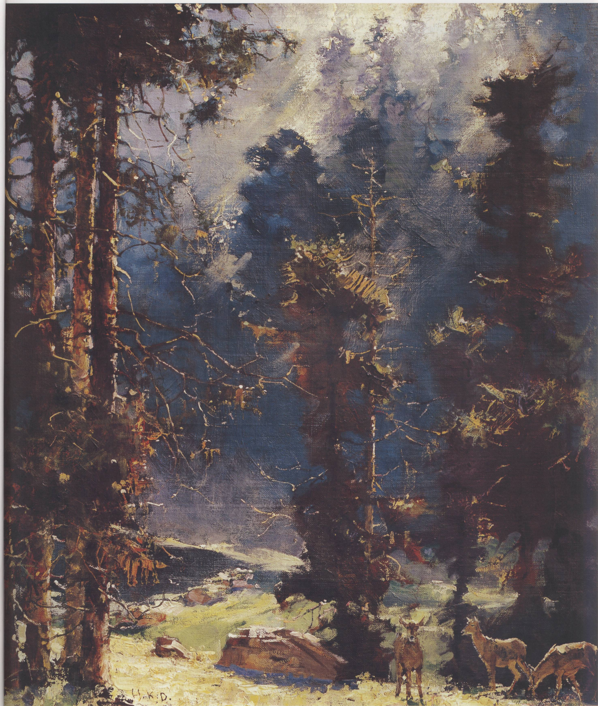
1. 梦华山在云雾中 布面油画 84cm × 73cm 1976年