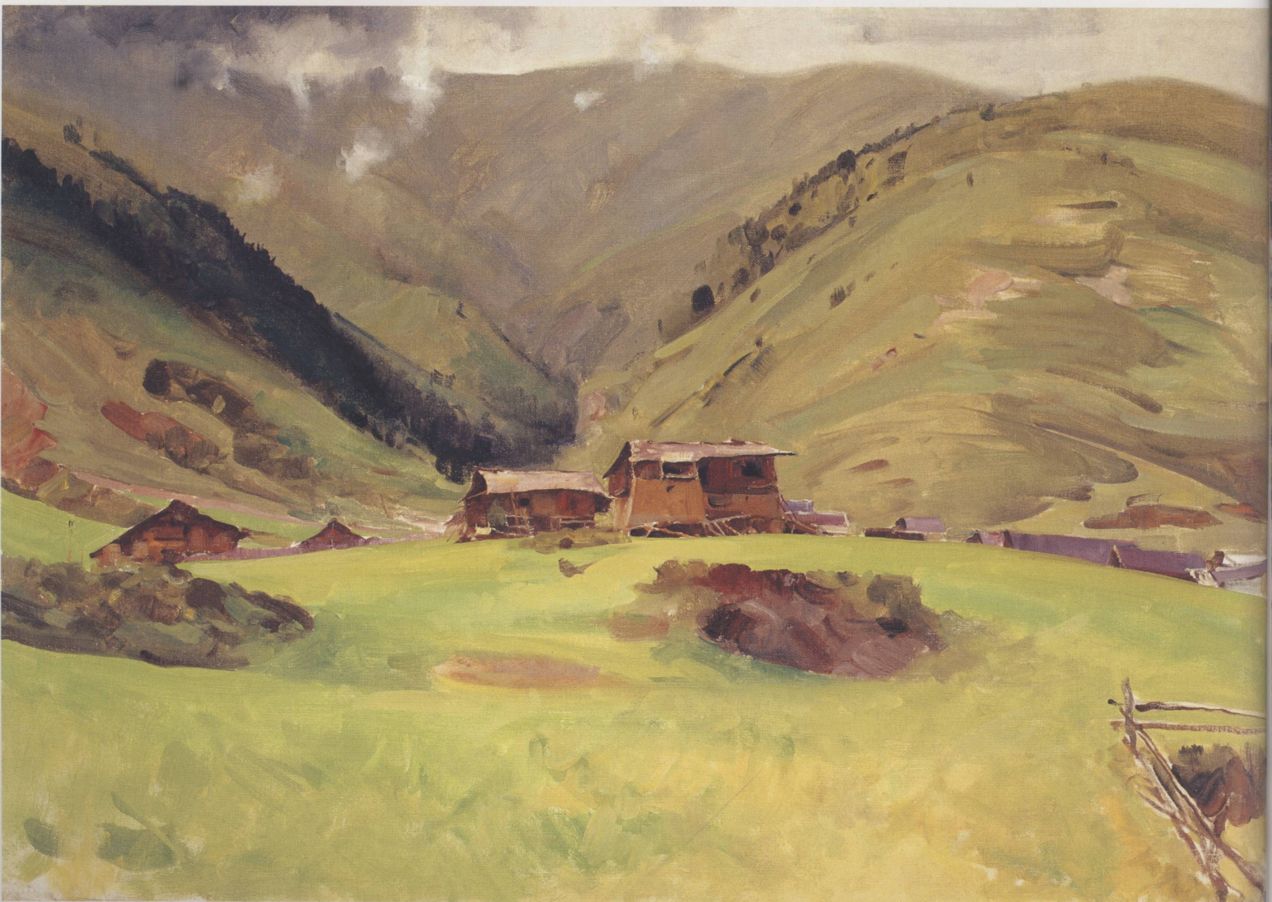
17. 山区 请在线购买: www.ertongbook.com