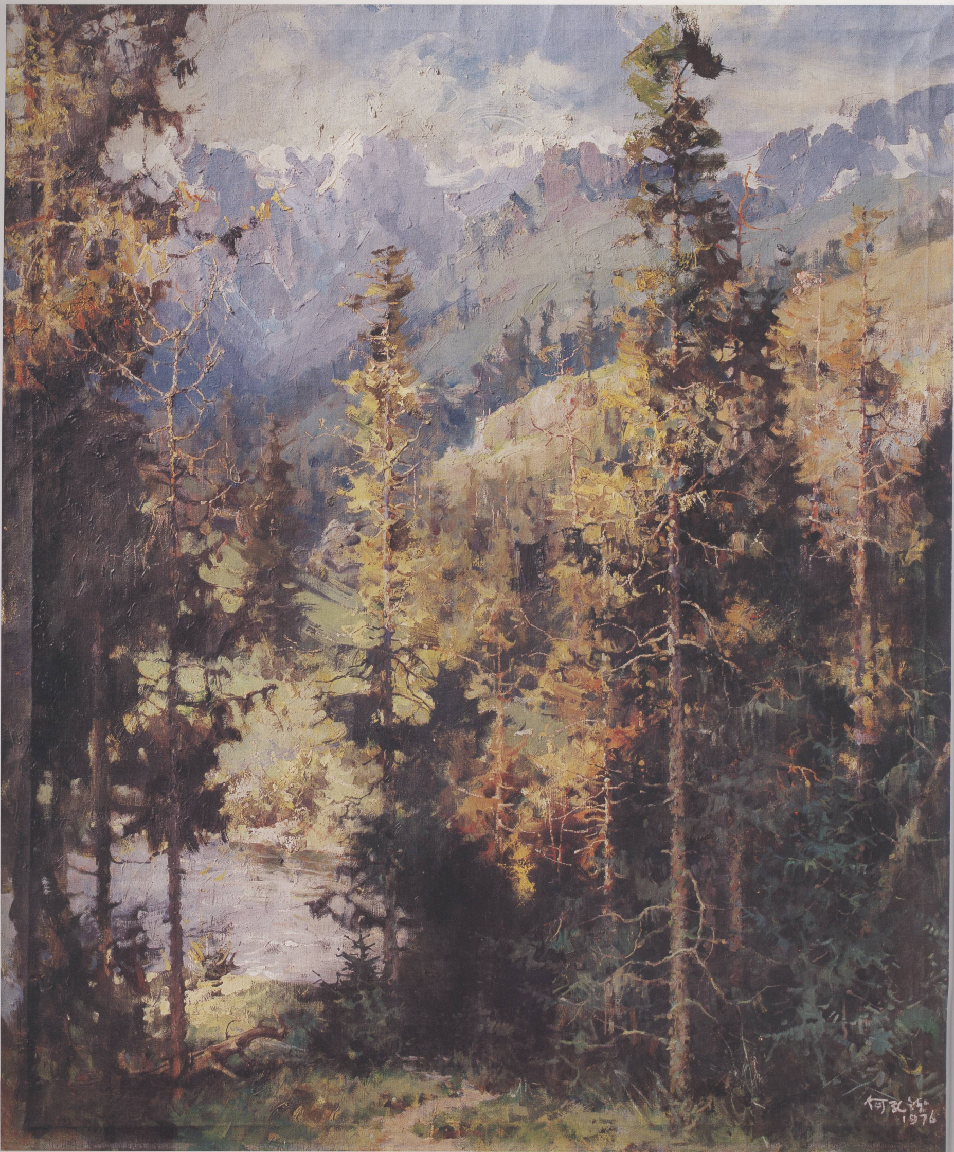
2. 梭磨河边 布面油画 112cm × 93cm 1975年