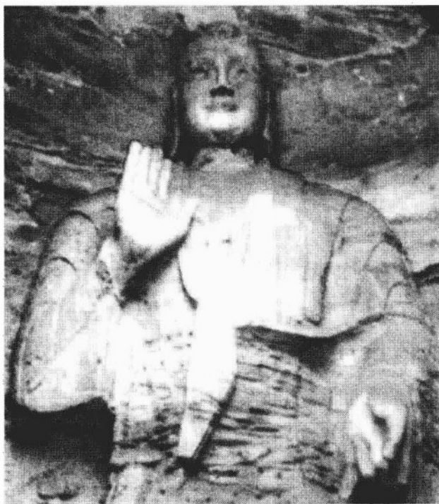
云冈石窟第16窟主佛像（高13.6米），据认为是以文成帝为原型塑造的 ①

世祖经略四方，内颇虚耗。既而国衅时艰，朝野楚楚。高宗与时消息，静以镇之，养威布德，怀辑中外。自非机悟深裕，矜济为心，亦何能若此！可谓有君人之度矣。（〔北齐〕魏收，《魏书》卷五《高宗纪·史臣曰》）