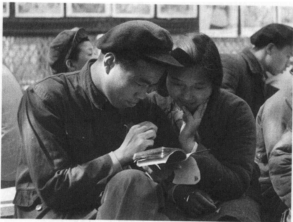
1953年3月22日，北京劳动人民文化宫举行宣传贯彻婚姻法游园大会。图为两名青年在观看宣传小册子。

“生死婚姻自己不能当家”，这是评剧《刘巧儿》中的一句唱词，描述了封建婚姻制度下妇女所受的束缚和摧残。几千年来，封建婚姻制度以夫权为中心，要求妇女恪守“三从四德”的封建礼教（即：在家从父、出嫁从夫、夫死从子；妇德、妇言、妇容、妇功），把妇女压迫在社会最底层，并剥夺男女婚姻自由。婚姻不自由是旧中国封建桎梏的一个重要表现，酿成了无数人间惨剧。