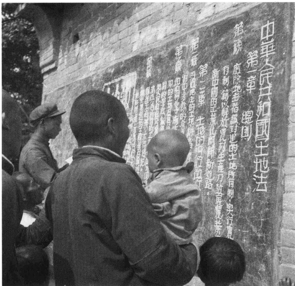
中央人民政府在1950年6月30日颁布了《中华人民共和国土地改革法》，受到农民的热忱拥护。这是河南省洛阳专区偃师县马滢乡的农民们正在阅读土地法。