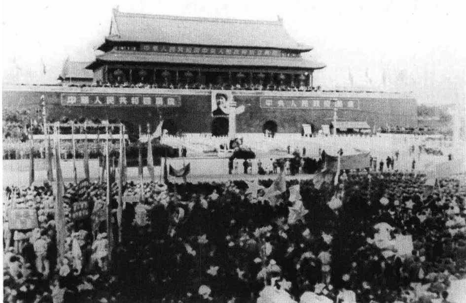
1949年10月1日，30万军民在天安门广场隆重举行开国大典。图为开国大典会场。

升旗结束后，毛泽东宣读了中央人民政府公告。接着举行阅兵式。朱德总司令在阅兵总指挥聂荣臻的陪同下，乘敞篷车检阅各兵种部队。检阅毕，朱德总司令宣读了《中国人民解放军总部命令》，指出：“现在我们的战斗任务还没有最后完成。……我们必须继续努力，实现人民解放战争的最后目的。”随后，人民解放军陆海空三军受阅部队以连为单位列成方阵，迈着威武雄壮的步伐由东向西行进，分列通过天安门前。刚刚组建的人民空军的14架战斗机、轰炸机和教练机，凌空掠过天安门广场。在阅兵式进行过程中，全场掌声经久不息，高潮不断。