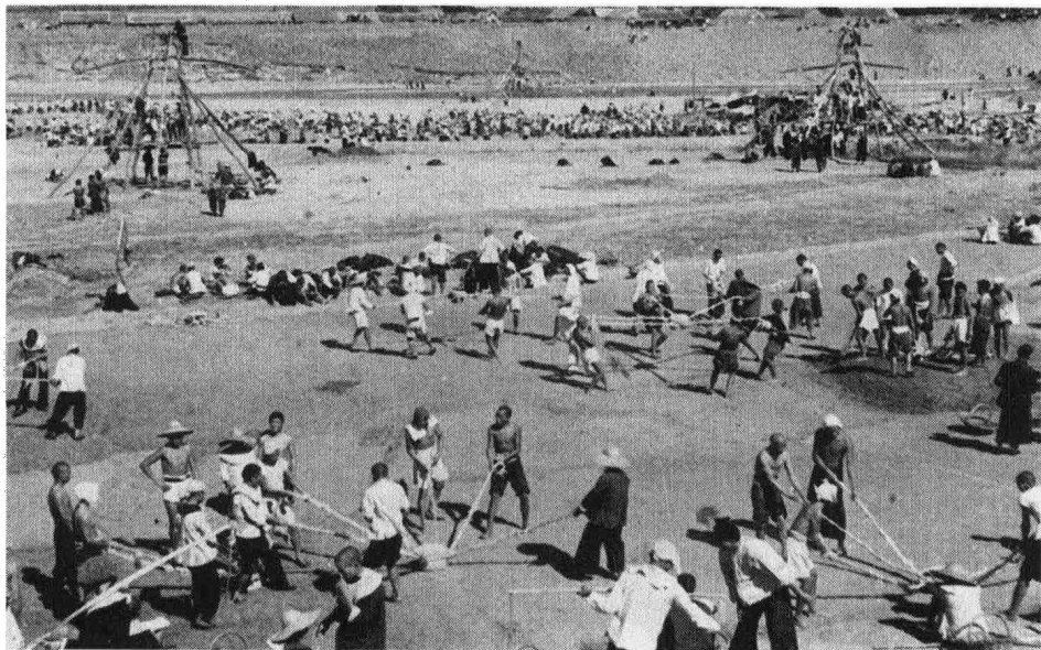
治理淮河的第二期工程中，民工在河南省泌阳县板桥水库工地施工。