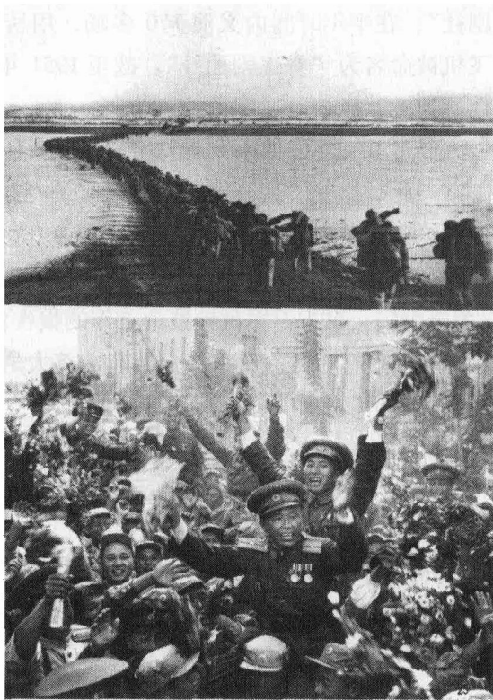
上图：中国人民志愿军跨过鸭绿江。下图：中国人民志愿军某部在归国前夕和朝鲜人民军某部举行告别联欢，朝鲜人民军战士热情地把志愿军战士高高举起。（新华社稿）

在这场异常残酷的战争中，中国人民志愿军谱写了气吞山河的英雄壮歌，创造了人类战争史上以弱胜强的光辉典范。在异国他乡，他们冒着严寒，在白雪皑皑的崇山峻岭中纵横驰骋、浴血奋战。在上甘岭战役中，他们在山头被敌人炮火削低两米的情况下，坚守阵地，决不后退一步。在敌人密集轰炸、严密封锁下，他们建成了打不断、炸不烂的钢铁运输线。在与“王牌空军”的较量中，他们以“空中拼刺刀”的勇气，创造出世界空战史上的奇迹。他们在极为艰难困苦的条件下，一把炒面一把雪，顽强拼搏，经受住了生命极限的考验。在朝鲜战场上，志愿军