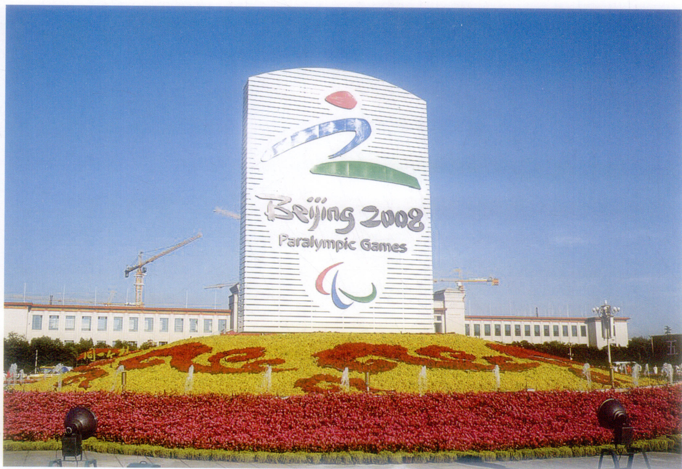
残奥会标志——“天地人”

次对运动的精神和意志的赞颂……会徽以天、地、人和谐统一为主线，把中国的文字、书法和残疾人奥林匹克运动精神融为一体，集中体现了中国传统文化和现代奥林匹克运动精神，体现了“心智、身体、精神”和谐统一的残疾人奥林匹克运动精神，具有深厚的中国传统文化底蕴。