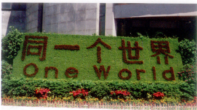
中国人民银行前的“同一个世界”造型