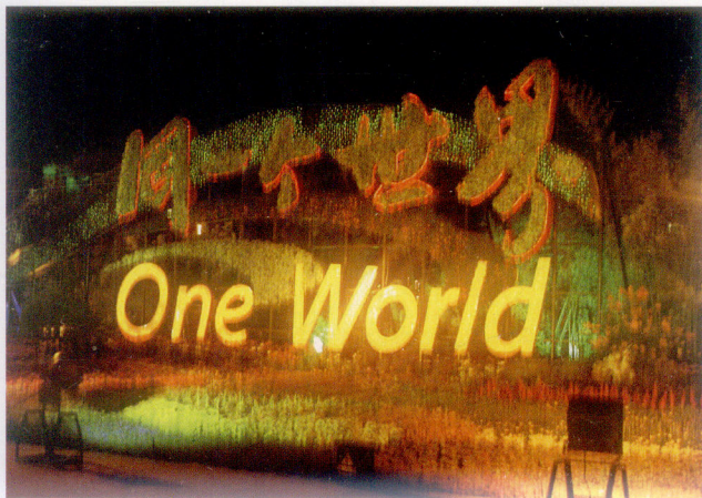
同一个世界造型夜景