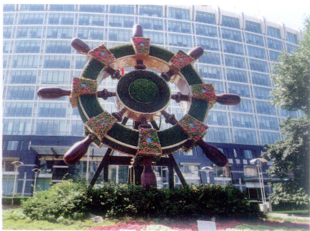
远洋大厦前的舵盘正面