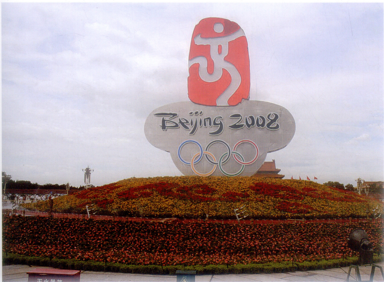
中国印日景

据国内外的形势来确定一个主题，此次奥运会期间天安门广场的花坛主题主要由两个方面组成，一方面展示中国的悠久历史文化、改革开放的伟大成就；另一方面主要体现奥运精神和普及奥运知识。