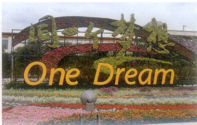
同一个梦想造型日景