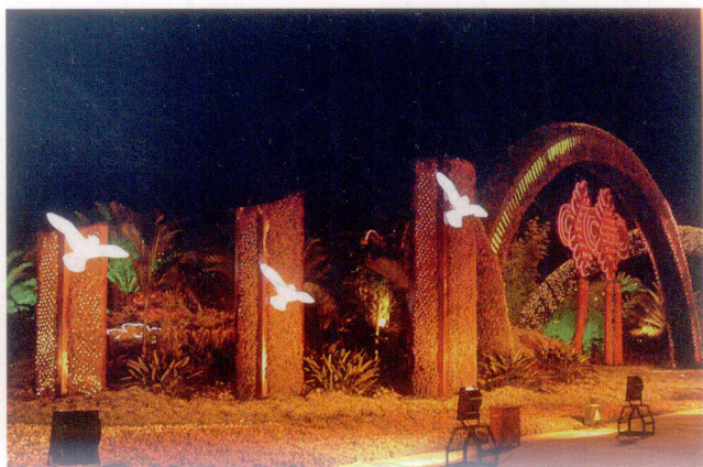
和平鸽、中国结、彩虹夜景