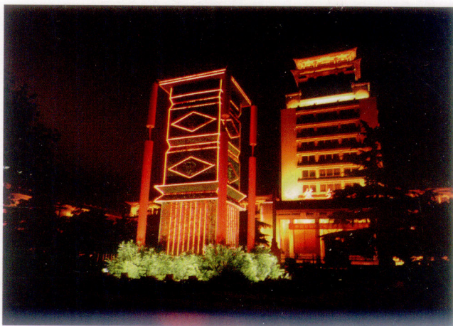
巨型花坛与民族文化宫主体建筑相互辉映夜景