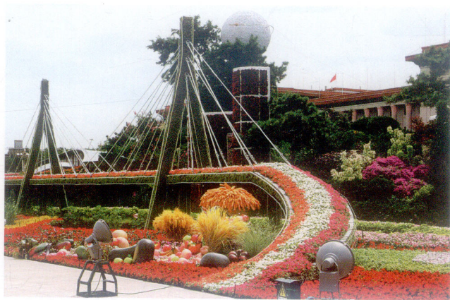
大型花坛与人民大会堂交相辉映日景