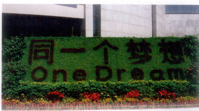
中国人民银行前的“同一个梦想”造型