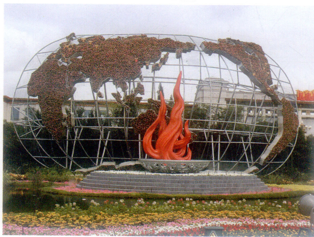
奥运圣火——世界地图构架日景

北京奥运会口号——“同一个世界，同一个梦想”。这是13亿中国人民对奥林匹克运动的独特而深