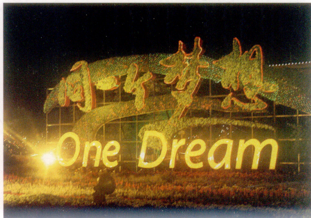
同一个梦想造型夜景