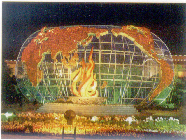
奥运圣火——世界地图构架夜景