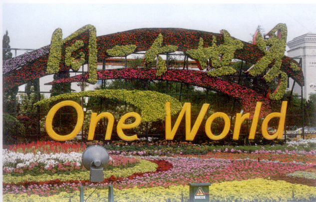
同一个世界造型日景