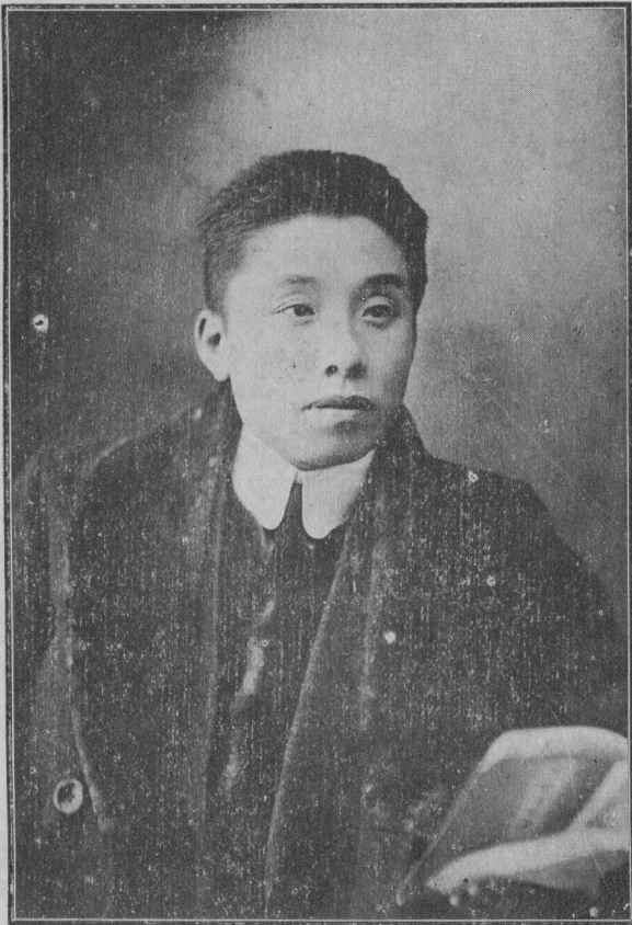
第六師師長方聲濤