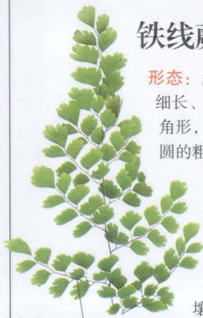
叶柄细长、坚硬，如铁丝

盆栽可置于案头、茶几上；较大盆栽可用于布置背阴房间的窗台、过道或客厅。②叶片是良好的切叶材料及干花材料。③全草入药，用于治疗人畜疾病。