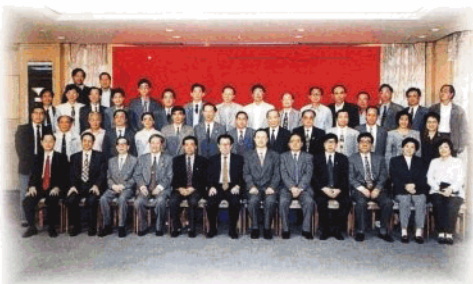
省委、省人大、省政府、省政协及有关部門的領導與來瓊考察的全國政協主席李瑞環合影。