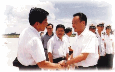
坚持为海南经济服务的指导思想,做好接待工作。图为办公厅领导与副总理吴邦国亲切握手。

1996年,省政府办公厅在省委、省政府的直接领导下,认真贯彻落实党的十四届五中、六中全会以及省委二届四次、五次全体(扩大)会议精神,坚持以科学理论、现代科学文化知识武装干部职工的头脑,加强制度建设,强化服务意识,团结进取,求真务实,开拓创新,圆满地完成了各项工作任务。