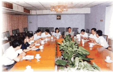
把为全省重点工作服务摆到突出位置，经常组织有关部门、单位召开现场会、研讨会、汇报会，解决实际问题。

往一处使，同心协力，埋头苦干。不少从事材料、接待工作的同志，经常自觉加班加点。三位打字员全年共打印各种文件资料约 460 万字。二是积极开展救灾捐款活动。1996 年第 18 号强热带风暴过后，全厅有 227 人捐款，共捐 23380 元；有 182 人捐送衣物，共捐 901 件。云南丽江地区发生强烈地震后，全厅捐款 5700 多元，为灾区人民献上了一份爱心。