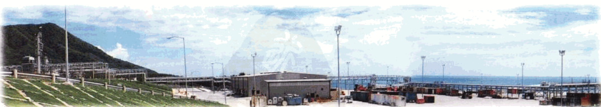
崖13-1天然气田三亚南山岸终端。