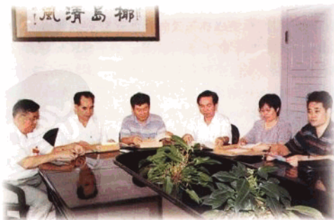
省纪委、省监察厅的案件检查人员在分析案情。