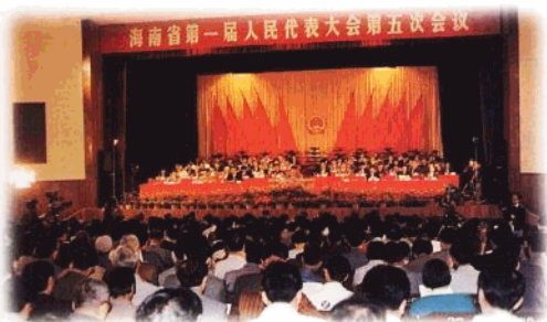
1997年1月召开的省一届人大五次会议会场。