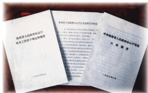
加强机关工作制度建设,建立健全各项规章制度,坚持按规章制度办事。

组织了省工业中专学校房屋产权问题、社会保障有关问题、鸿沟岭矿区土地权属问题等的协调 301 次,解决问题 203 个。在组织协调过程中,坚持调查研究,以事实为依据,以政策、法律为准绳,耐心细致,效果显著。