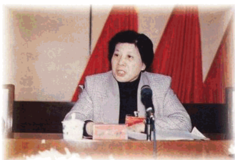
中共海南省委常委、省纪委书记董范园。