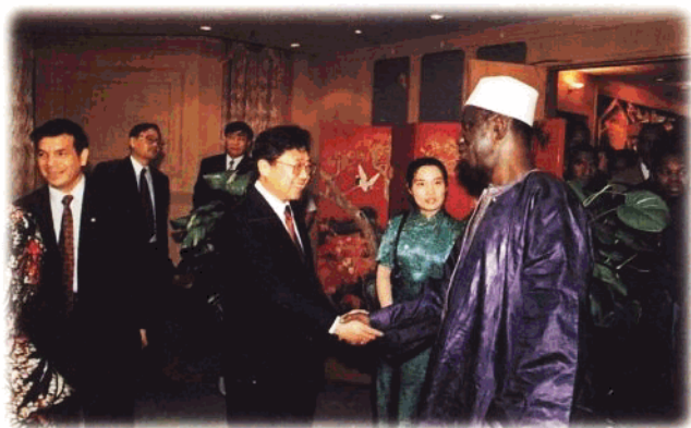
1996年6月19日,阮崇武省长会见几内亚总统兰萨纳·孔戴。