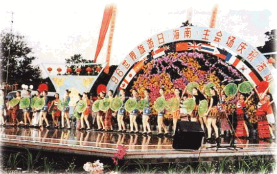
1996年9月27日世界旅游日(海南)主会场庆祝活动。