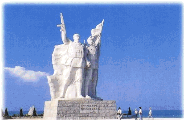
1996年10月21日,“解放海南纪念塑像”在临高角落成。