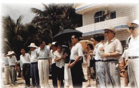
省政協常委們經常深入基層考察、調查和指導工作，足跡遍布全省城鎮鄉村，解決了許多實際問題。