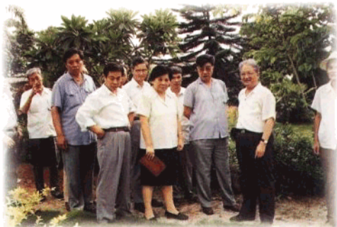
省委常委、省纪委书记董范园陪同全国人大常委会何康在海南热作两院考察。

干部队伍建设进一步加强。 全省各级纪检监察机关把干部队伍的自身建设放在十分重要的位置,不断加强对干部的政治学习和思想教育,加强业务技术培训,加强干部队伍的监督管理和作风建设,努力建设一支政治坚定、纪律严明、作风优良、业务过硬的大特区纪检监察干部队伍。到1996年底,省、市、县、区纪检监察机关已建立健全,168个行政机关和309个企事业单位设立了纪检监察机构,306个乡镇成立了纪律检查委员会,全省纪检监察机构达835个,纪检监察网络已经形成。全省已建立起一支拥有专职人员2238人、兼职人员1261人的纪检监察干部队伍,成为大特区反腐倡廉的主力军。