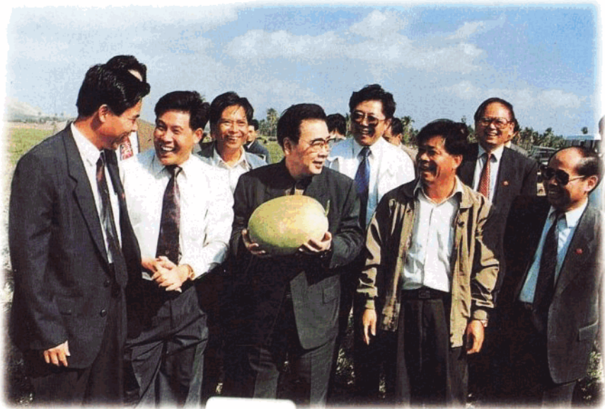
1996年2月12日,李鹏总理在三亚市羊栏镇妙林村考察冬季西瓜。