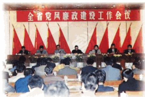
省委、省政府对全省反腐败斗争和党风廉政建设工作进行部署。

扎实开展纠风专项治理。 针对广大群众和社会反映强烈的不正之风问题,各级纪检监察机关和有关部门紧密配合,先后组织开展了清理行政事业性乱收费、用公款出国出境旅游、党政机关