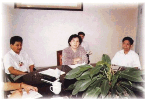
省纪委常委会议研究部署全省反腐败三项任务督促检查工作。