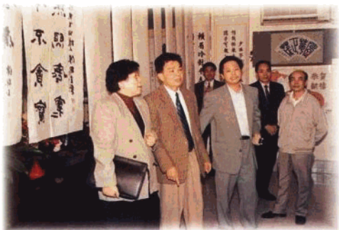
省纪委、省监察厅多次举办全省纪检监察系统书画图片展,委厅领导亲自绘制作品参展。

海南省纪检监察机关自1993年合署办公以来,在中央纪委、监察部和省委、省政府的领导下,坚持以邓小平建设有中国特色社会主义理论和党的基本路线为指导,紧紧围绕特区改革开放和经济建设的实际,充分履行监督检查职能,深入开展反腐败斗争,大力加强党风廉政建设,为海南的改革、发展、稳定,为特区的物质文明和精神文明建设做出了积极贡献。