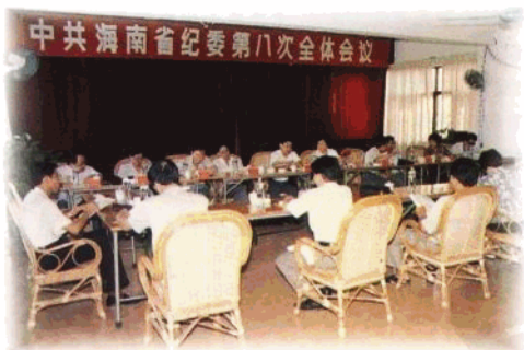
省纪委全体会议研究部署全省反腐败斗争及纪检监察工作。