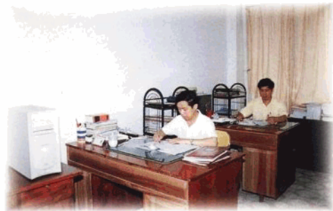
改变机关工作作风,工作效率和质量明显提高。