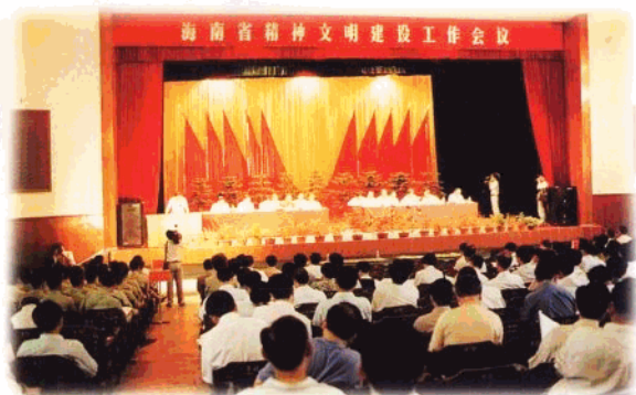
1996年10月31日,海南省精神文明建设工作会议在海口召开。(省精神文明办供稿)