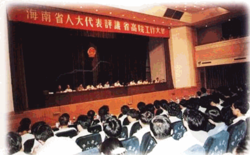
1997年6月,省人大常委会组织代表评议省高院工作。图为大会会场。

1988年8月,海南省人民代表会议第一次会议在海口召开,选举产生了由32人组成的海南省人民代表会议常务委员会。海南省人民代表会议及其常委会代行省级人大及其常委会的职权。