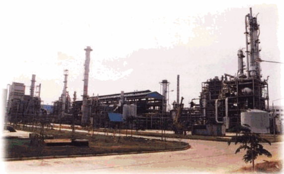
1996年10月,实际投资25.18亿元人民币,建设规模为年产30万吨合成氨、52万吨大颗粒尿素和3万吨甲醛的海南天然气化肥厂试车成功。