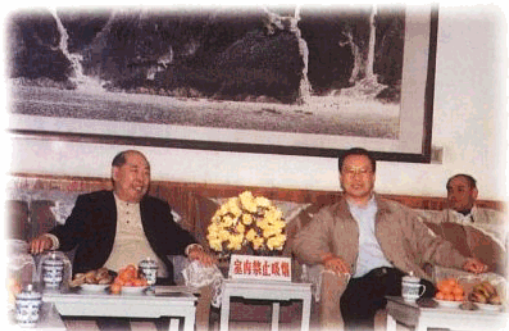
全国人大常委会副委员长王丙乾1996年12月来琼视察期间,亲切会见省人大常委会机关全体工作人员,并和厅级以上干部进行座谈。图为王丙乾和省人大常委会主任杜青林在一起。

任免 按照地方组织法的规定,省人大及其常委会注意做好人事任免工作,行使选举、任命、罢免、免职、撤销等各项权力。仅1996年,人大及其常委会共任免101人,其中任命省人大常委会副秘书长和各工委、室负责人6人,免职3人;公告撤销省人大常委会副主任职务1人;任命省政府副省长2人,厅长7人,免职2人;任免海南省高级人民法院、海南中级人民法院工作人员31人,免职10人,撤销审判员职务2人;任命省人民检察院、海南检察院分院工作人员20人,免职10人;批准任命检察长4人,免职3人。(省人大常委会办公厅研究室供稿)