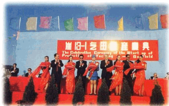
1996年1月12日,崖13-1天然气投产庆典在三亚南山举行。