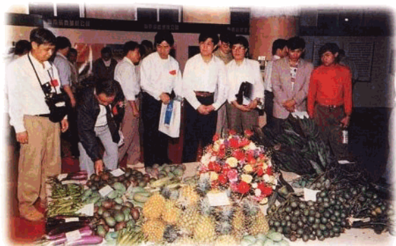
'96年全国(海南)农业开发项目招商洽谈会上展出的新品种瓜菜。