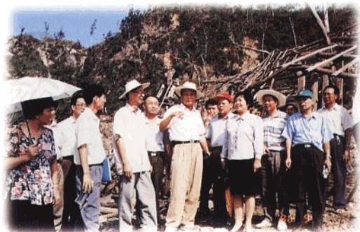
省人大常委会组织“环保世纪行”活动,图为检查团在乐东县抱伦尖岗岭金矿区视察。