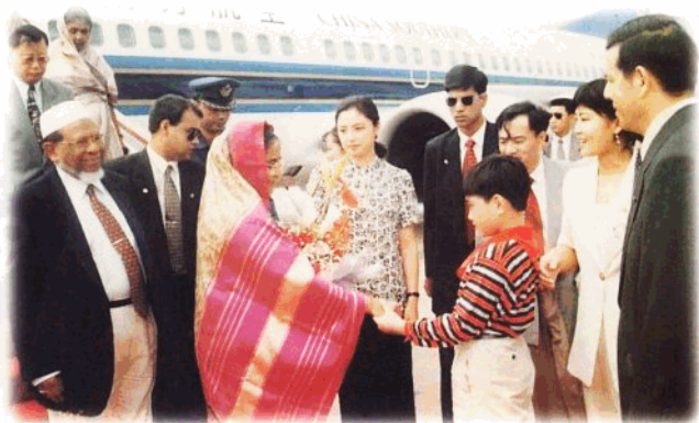
1996年9月15日,孟加拉共和国总理谢赫·哈西娜访问海南。 (省外办供稿)