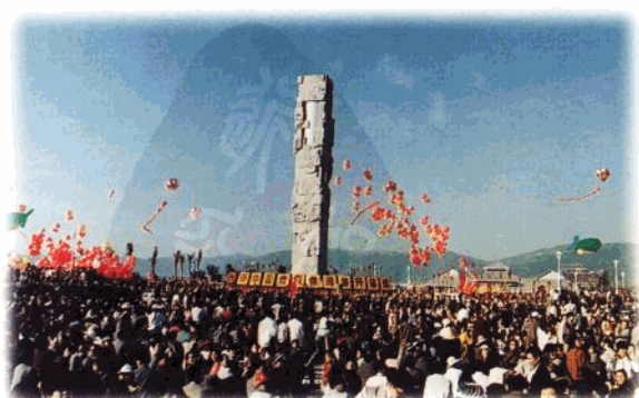
1996年1月1日,'96中国度假休闲游开幕式在三亚亚龙湾中心广场举行。