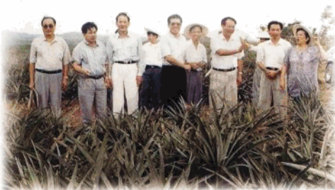
省政協常委參觀萬寧市龍滾鎮萬畝菠蘿基地。