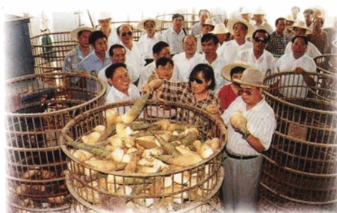
省政协常委视察儋州市甜笋加工厂。