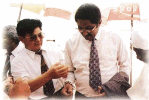
省纪委副书记、省监察厅厅长吴振钧陪同来访的苏丹共和国行政监察部第一副部长卡莫尔·穆罕默德·辛因博士在海南考察。