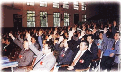
出席省人代会的代表表决通过大会决议。