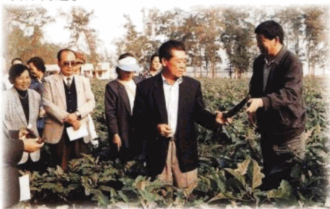
省政協領導視察海口市羅牛山“菜藍子工程”無公害蔬菜基地。