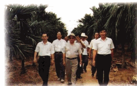
省政协领导视察乐东县槟榔种植专业户的槟榔基地。