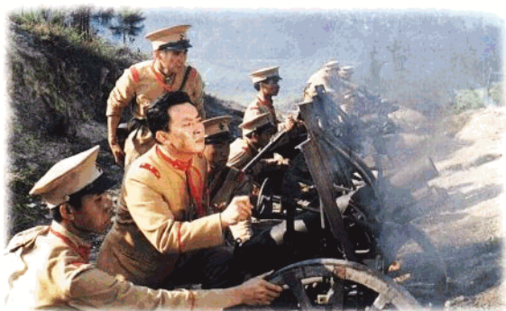
由海南影业公司拍摄的获第5届全国“五个一工程”奖的 电视剧《叶剑英》。