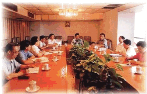
不断加强领导班子思想政治建设，学好用好理论；坚持民主集中制，勤政廉政。