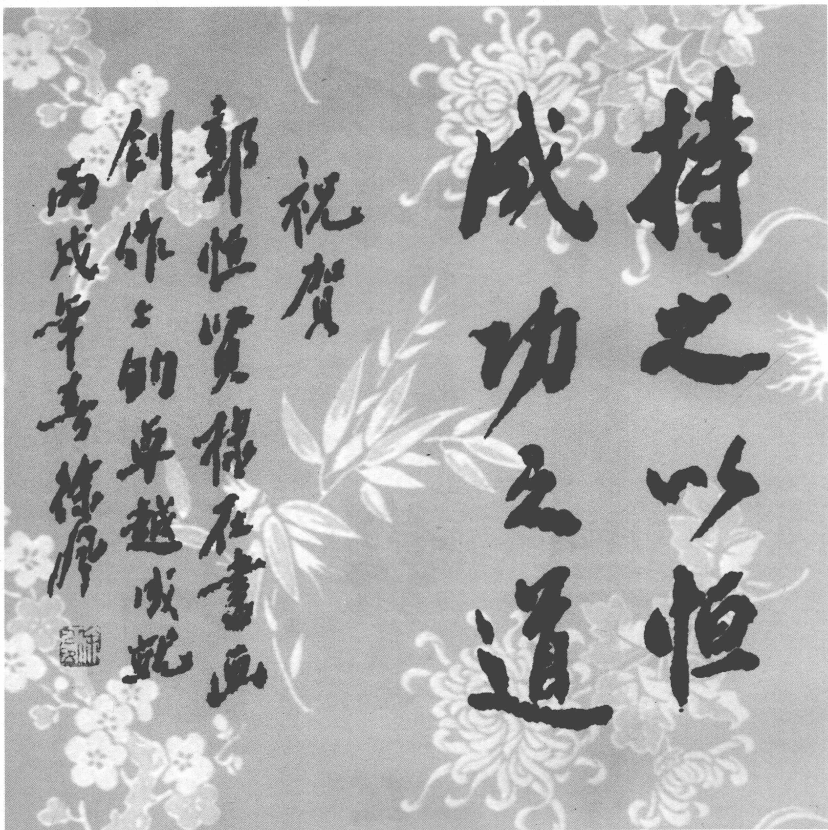
持之以恆 成功之道 徐風題