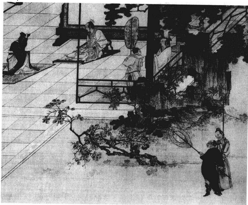
■ 清·焦秉贞《孔子圣迹图》