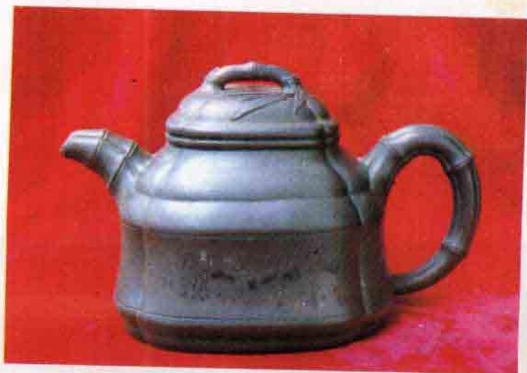
上 泥绘 清·园林 中 扁灯 清·大亨 下 四方抽角竹顶 顾景舟