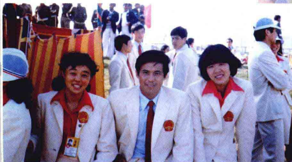
迟尚斌与孙晋芳、郎平合影