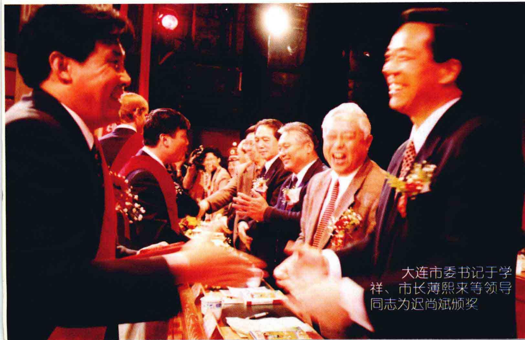
大连市委书记于学祥、市长薄熙来等领导同志为迟尚斌颁奖