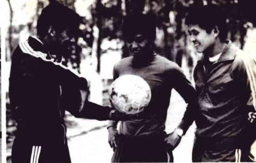
当年的“迟氏三雄”在切磋技艺