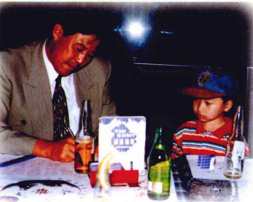
迟尚斌为小球迷签名