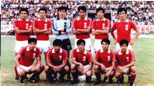
1981年迟尚斌（后排左一）代表中国队参加第十二届世界杯预选赛时与队友合影