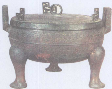
▲ 蟠虺纹鼎 春秋

西伯是古公亶父的孙子,即后来的文王。他继承后稷、公刘的遗业,效法古公、公季的成规,笃行仁政,敬重老者,爱护晚辈。对贤士谦下有礼,德才兼备者因此多归附于他。当时纣王受了崇侯虎的挑唆,将西伯囚禁在羑里,后因有人以美女、珍奇之物送给纣王,纣王才释放西伯。西伯推行仁政,诸侯若有争讼都来请他裁决。当时虞、芮两国人有了纷争不能解