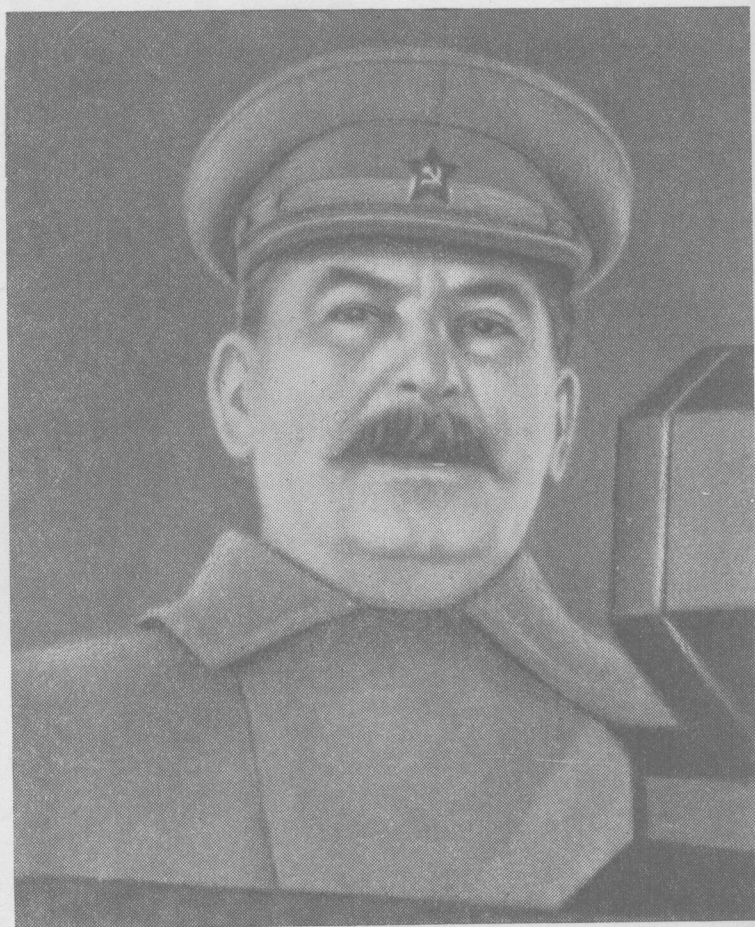
科斯莫在日七月一十年一四九一於 林大斯、約 片照的時軍紅閱檢場紅